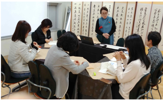
<사진 6> 참가자들의 배넛저고리 만들어보기

<사진 6>은 명상과 침선을 적용한 태교 콘텐츠시범운영 중 침선으로 배넛저고리 만드는 모습이다. 바느질은 임부의 마음을 안정시키고, 태아에 대한 애착을 증진하는데 도움이 된다. 손을 많이 사용 하는 침선, 즉 바느질은 주의력과 감각을 집중하도록 하여 태아의 두뇌 발달에 도움이 되며, 바느질 하는 동안 집중 하게 되면 임신부의 심리적 안정에 도움이 될 것으로 보인다.