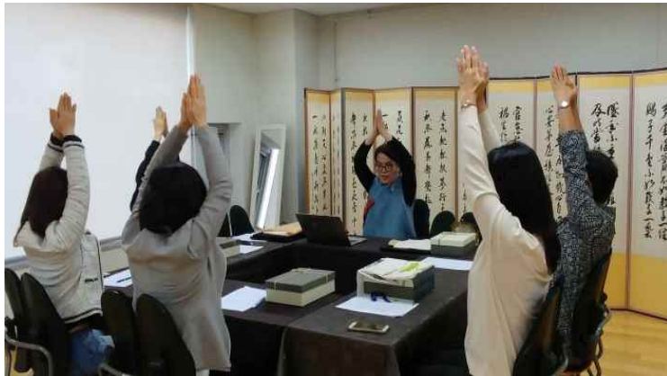
<사진 8> 바느질 중간 스트레칭

<사진 8>은 바느질 중간 중간 스트레칭 하는 모습으로 장시간 고개를 숙이고 바느질 하느라 힘든 임신부의 몸을 풀어주는 동작이다. 손목 스트레칭과 긴장된 어깨와 목을 풀어주는 동작을 시행하였다. 같은 자세를 오래도록 하고 있으면 혈액순환에도 좋지 않아 부종이 생기기 쉽다. 바느질 중간 일어나서 몸을 움직이기를 권했다.