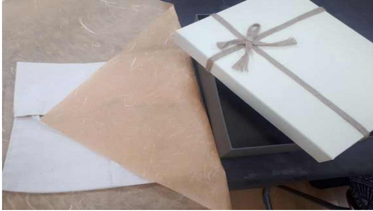
<사진 10> 배넛저고리 포장