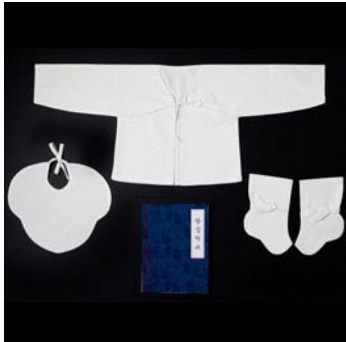
<사진 3> 배냇저고리, 턱받이, 버선

또한 아기가 잘 때 덮어주는 침구의 하나로 이불이 있으며, 이는 계절에 따라 솜을 넣어 만들기도 하고 그 종류로는 겹이불, 홑이불 등이 있다.