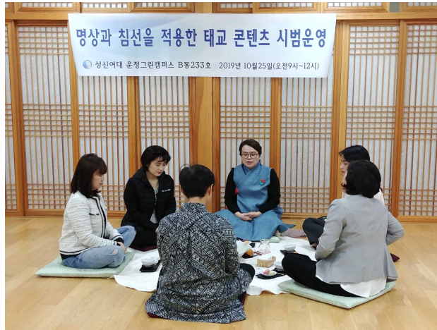
<사진 4> 명상과 침선을 적용한 태교 콘텐츠 시범운영