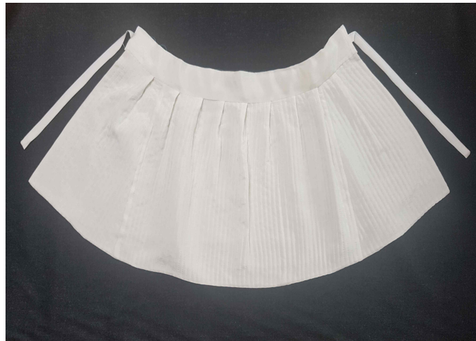
<사진 2 > 두렁치마 (저자의 작품: 2019)

두렁치마는 주름을 잡아 허리에 띠를 댄 어른 치마와 같은 형태로 뒤가 겹치지 않고 엉덩이가 보이게 입다. 그래서 기저귀를 갈기 편리하다. 두렁치마는 초이레나 두이레부터 입히기 시작하여 돌까지 입히기도 했다(안귀주, 2019).