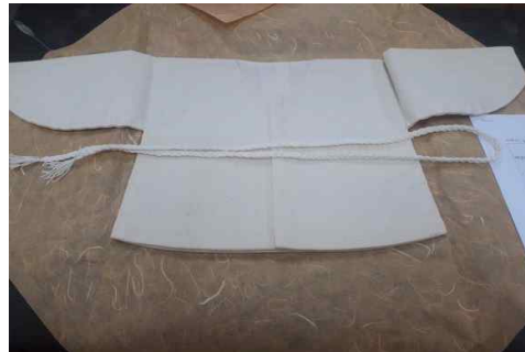
<사진 7> 완성된 배넛저고리

배넛저고리는 반제품을 활용하였다. 바느질에 서툰 임신부의 경우 배넛저고리를 만들기 위해 재단까지 하기에는 무리가 있어, 반제품이 적당하다고 판단되었다. 저고리의 옆선과 배래의 바느질과 고름달기가 한 시간 동안 이루어졌다. 누워있는 아기가 입을 배넛저고리는 시접이 밖으로 드러나지 않게 하기 위해 공그르기와 감침질로 바느질한다. 고름은 명주실 21가닥을 7줄씩 셋으로 나누어 꼬아 만들었다. 명줄을 의미하며 홀수로 좋은 기운을 받으라는 뜻이다. 한 시간의 바느질은 임신부들에게는 신체적으로 무리가 될 수 있으므로 바느