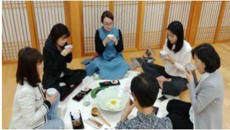
<사진 9> 연꽃 차 명상

임신부의 경우 일반 녹차성분 중에 여러 부 작용이 있을 수 있으므로 연꽃차를 사용하였다. 연꽃 차는 카페인 성분이 없고 산후 임신부에는 지혈작용이 있으며 피를 맑게 하는 차이다. 간단한 다식을 곁들여 차를 마심으로 바느질하느라 긴장했던 몸과 마음을 풀어주었다. 음악과 함께 차명상과 가벼운 대화를 했다.