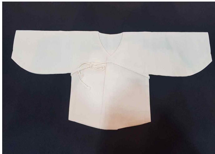
<사진 1> 배넛저고리 (저자의 작품: 2019)

배넛저고리도 남녀 차별이 있었다. 여아용 배넛저고리는 소매길이를 짧고 소매통도 좁게 하였으며, 여아가 입었던 배넛저고리는 물려주지도 않았고, 여자아이의 것은 귀히 여기지도 않아서 남아 있는 유물도 귀하다. (안귀주 . 2019)