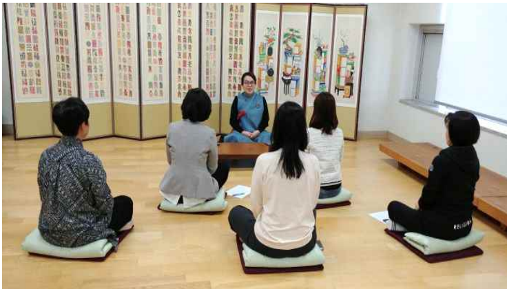
<사진 5> 호흡명상

태교 콘텐츠 시범 운영안대로 제일 먼저 연구자와 참여자의 인사가 있었다. 연구자는 시범운영 일정을 참여자에게 설명하였다. 그런 다음 편히 앉은 자세로 호흡명상을 실시했다. <사진 5>는 호흡명상 모습이다. 호흡명상은 임신부의 호흡을 안정시키기 위해 실시한다. 임신부가 임신 말기에 횡경막까지 아기가 올라오게 되면 호흡이 짧아지며 그로인해 혈액순환까지 힘들어지게 되어 부종과 여러 불편한 점이 생기는 것을 예방하기 위한 연습이다. 호흡명상에서는 들숨과 날숨의 조절이 중요하다.