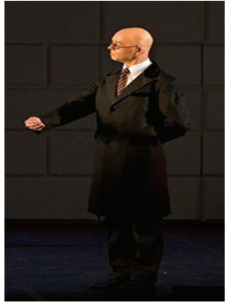
그림-16. 로드발트( 뱀피빠 & 매튜 본)