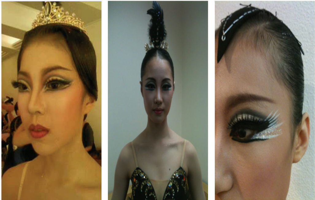
그림-19. 오딜의 재구성

눈썹- 진브라운 펜슬로 본인의 눈썹에서 3분의1지점에서 날렵하게 살짝 각이 지게 그리며 검정펜슬도 함께 사용하였다.