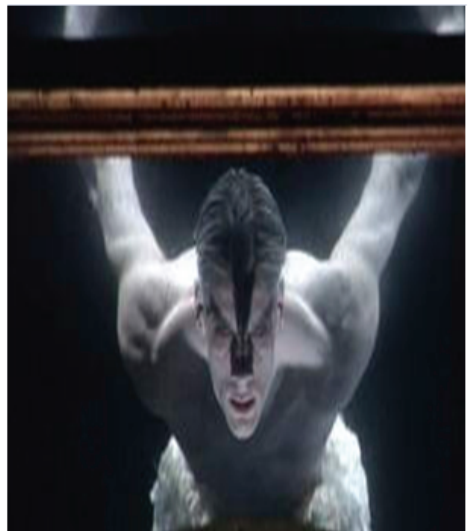
그림-9. 매튜 본 백조의 호수

출처: http://ko.wikipedia.org 2011년 3월 30일