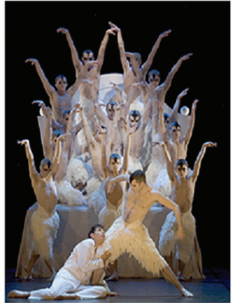
그림-17. 백조(쁘띠빠 & 매튜 본)