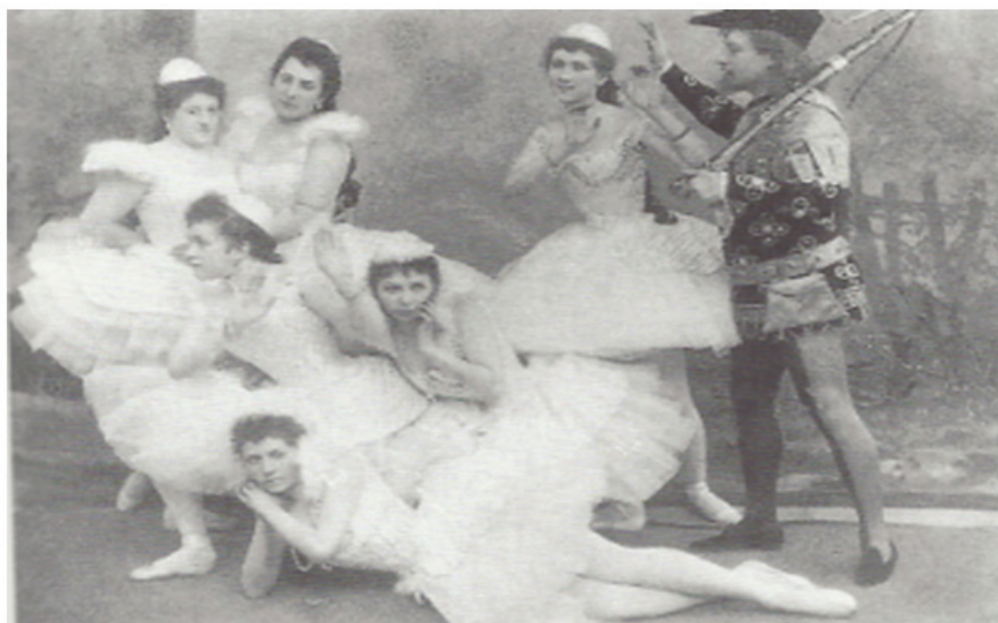
그림-7. 상트페테르부르크에서 초연 된 백조의 호수(1895년)

(출처: http://ko.wikipedia.org 2011년 3월 30일)