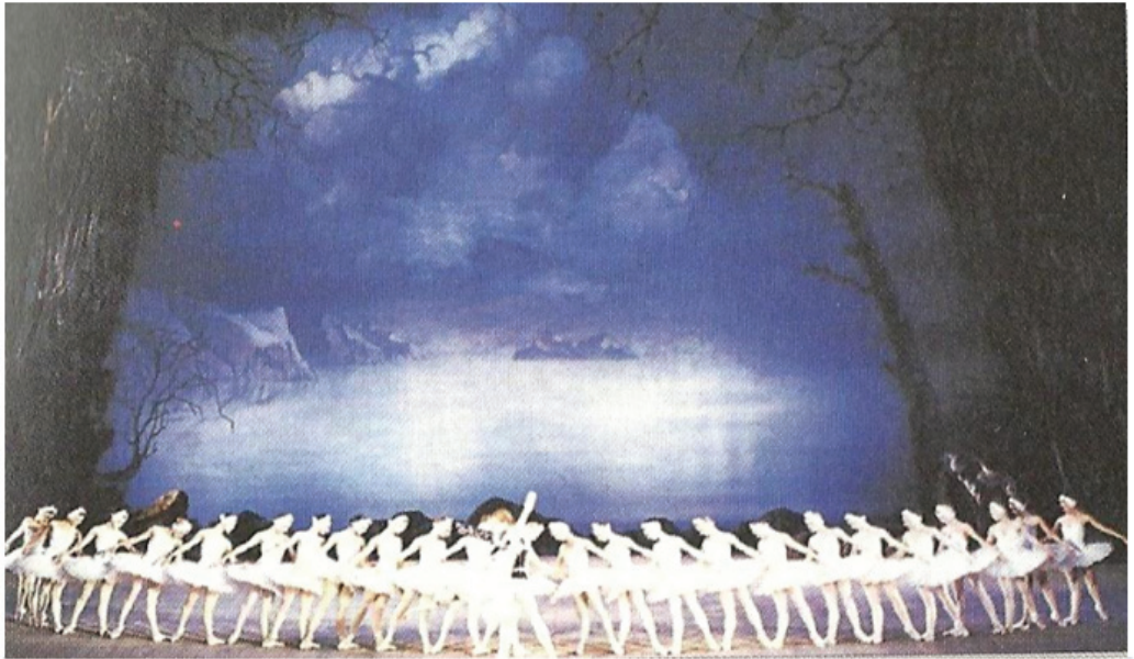
그림-4. 백조의 호수 2막 무대장면(클래식 튀튀의 등장)

어 올려진 다리와 고도로 훈련된 포인트 테크닉을 관객들에게 보여주기 위하여 얇고 뻣뻣한 모슬린을 여러 겹으로 쌓아 만든 발레리나의 스커트는 현재와 같이 다리 전체를 드러나게 하는 클래식 튀튀(Classic Tutu)가 출현하게 된다. 27)