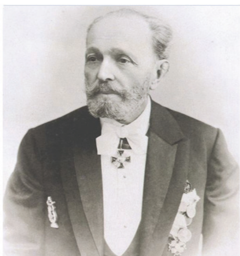
그림-5. 마리우스 뷔띠빠