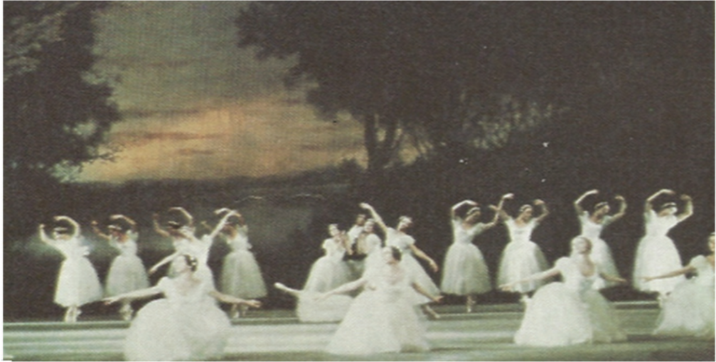
그림-3. 공기의 정 무대장면 1908년 마린스키 극장

가스등은 달빛을 표현하는데 매우 중요한 도구로 사용되었고, 스코틀랜드를 배경으로 공기의 요정이 결혼식을 앞둔 청년을 유혹하는 내용을 담은 공기의 정은 낭만적인 충동을 완벽하게 담아냈다는 평가 함께 낭만발레의 붐을 조성하기에 충분 하였으며, 백색 뿔뿔이 대유행해 백색발레(ballet blanc)라는 용어까지 등장했다. 12) 한편, 낭만주의 발레가 융성하던 시기에는 점점 더 여성의 역할이 강조되어 당대의 유명한 발레리나는 파리와 런던이외에도 밀라노, 코펜하겐 등 전 유럽을 순회 공연하였다. 무대 위에서 남자무용수의 모습을 찾아보기 어렵게 되었으며, 이것은 후에 낭만주의 발레가 다양성을 추구하지 못하고 매너리즘에 빠져 몰락하게 되는 하나의 원인이 되었다. 13)