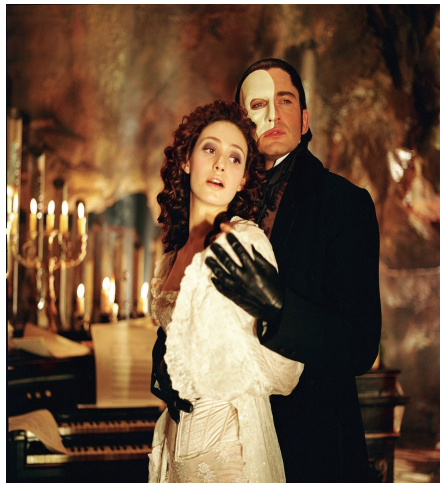
<그림 1> 오페라분장

거리가 먼 공연 공간의 특성에 맞게 배우의 모습을 보다 명확하고 확실하게 표현해야 한다. 또한 오페라는 화려한 의상과 많은 변화가 이루어지는 웅장한 무대 세트와 화려한 색채로 다른 무대극보다 가장 강한 톤의 무대분장을 한다.