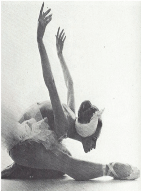
그림-11. 뉴욕시티발레단 백조의 호수의 오델트