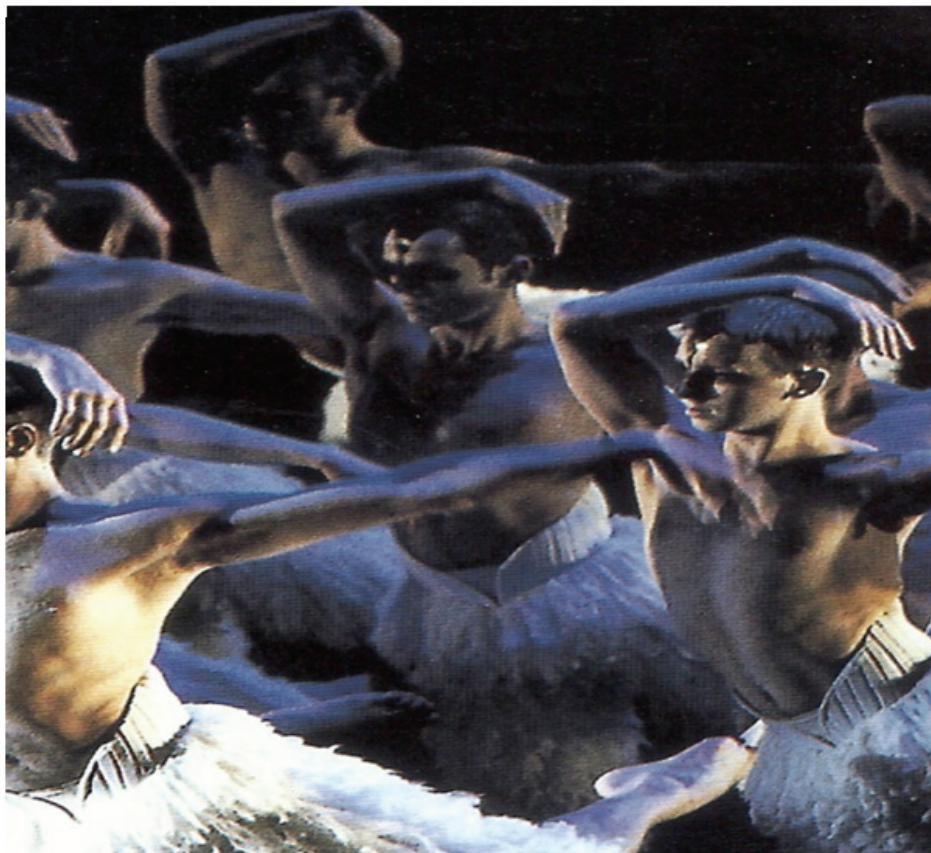
그림-10. 매튜 본 백조의 호수