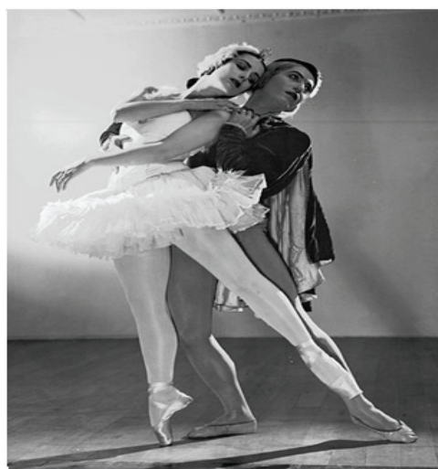
그림-6. 초기 백조의 호수

(출처: http://ko.wikipedia.org 2011년 3월 30일)