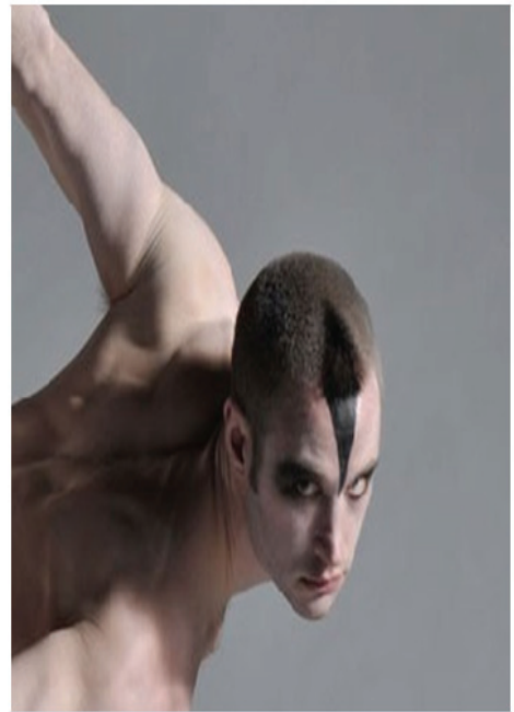
그림-12. 매튜 본 백조