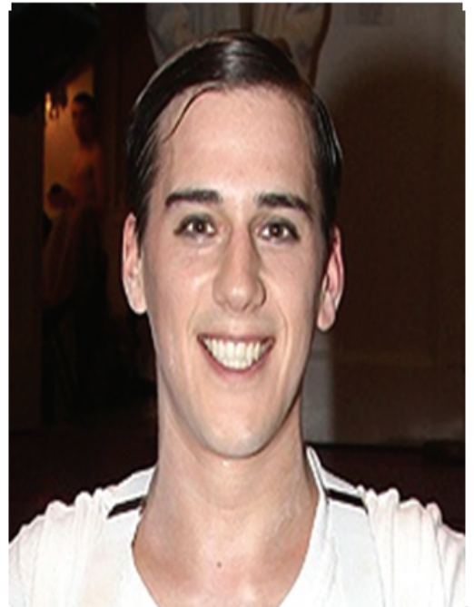
그림-15. 지그프리드 왕자( 뻘띠빠 & 매튜 본)