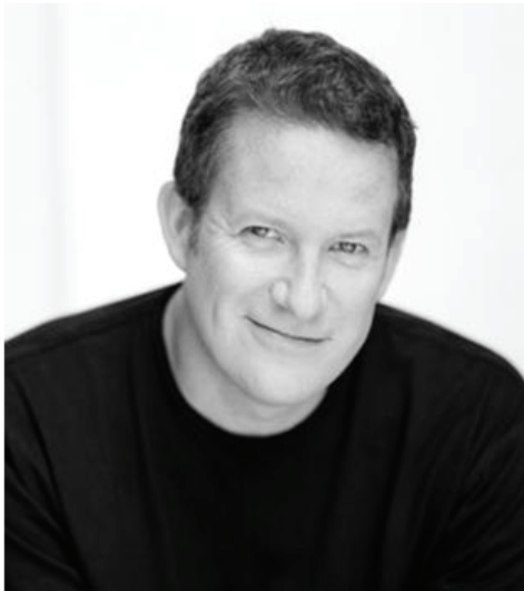
그림-8. 매튜 본

영국 런던의 라반센터(Laban Center)를 졸업 한 매튜 본(Matthew Bourne 1960-)은 27세의 나이에 AMP(Adventures in Motion Pictures)를 창단하고 기존의 정형화된 고전 발레 레퍼토리들의 난해한 발레 움직임들을 배제하고 현대적인 감각으로 재 해석한 작품들을 소개하였다. 매튜 본은 창조적인 노력으로 작품과 음악이 가지고 있는 의미들을 전달하기 위해 발레, 현대무용 뿐만 아니라 뮤지컬, 영화, 사교댄스, 볼룸댄스 등 그 어떠한 움직임이라도 선택해서 사용하는 ‘댄스 뮤지컬’이라는 새로운 장르를 선보였다.