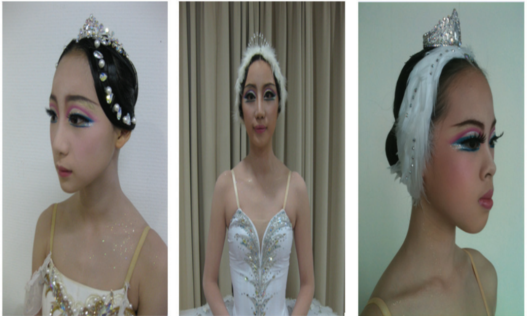
그림-18. 오데뜨의 재구성

아이라이너-눈을 크게 보이기 위해 눈 밑을 띄워서 쳐지지 않게 파란색 펜슬을 이용하여 그리며 창백한 느낌을 주기위해 파란색 아이라이너와 검정색 라이너를 사용한다.