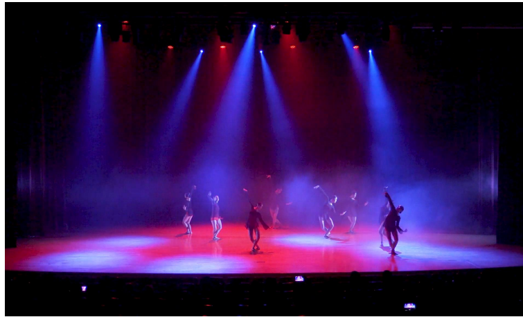
그림 16. 공연 중 『불』

‘풍 『風』’ 바람은 인생의 끝, 시련과 죽음을 표현해냈다. 아이유의 ‘바람꽃’을 통해 부채 같은 소품을 사용하여 바람의 훑날림을, 소향의 ‘홀로아리랑’ 음악을 통해 등불 소품으로 등불의 빛을 바람에 훑날리는 반딧불이 또는 불꽃으로 비유한다. 이 파트 때는 댄서들을 비추는 조명보단 등불의 빛을 부각시키기 위하여 밝은 조명 대신 어두운 조명만 낮게 깔린다. 죽음과 시련을 표현해낸 파트에서는 힙합 중 가장 강력하고 힘을 최대한 보여줄 수 있는 크럼프라는 장르를 혼합하여 조명이 아닌 댄서들이 직접 손전등을 통해 조명을 표현하였다. 불빛이 일렁이는 조명, 핀 조명으로 죽음의 쓸쓸함을 보여주었고 조명과는 다른 손전등 같은 불빛으로 혼란스러운 시련을 보여준다.