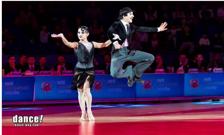
그림 5. 쇼댄스