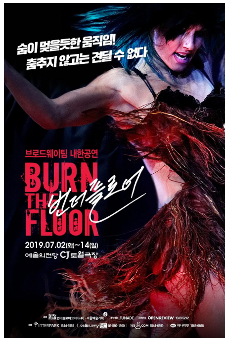
그림 13. 「번 더 플로어」 플로어 포스터