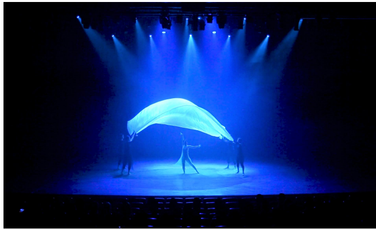
그림 15. 공연 중 『물』

천 밖에서 춤을 추는 댄서들은 배가 되기도 하고 배를 타고 있는 여성 또는 수영하는 여성이 된다. 반대로 천안으로 들어가서 그 속에서 춤을 출 때에는 물속에서 생존하는 생물들로 표현이 된다. 생명이 태어나 많은 자연들과 환경 속에 자라남을 통해 성장에 한 발 내딛는 그러한 시기를 물로 빗대어 표현하였다.