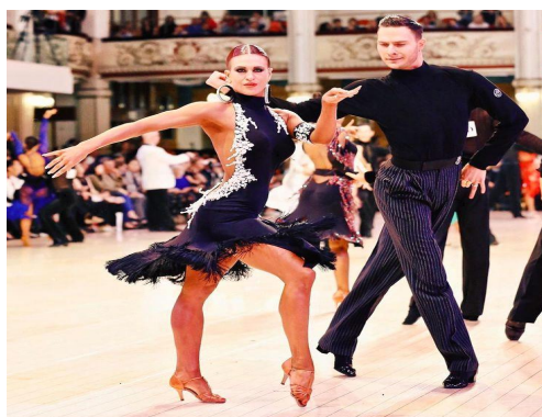
그림 2. 커플(Couple)댄스

자이브는 정상적인 세 박자의 리듬 대신에 한 박자의 리듬 동작을 사용하면 음악적으로 대조적인 효과를 강렬하게 연출할 수 있다. 예를 들어 처깅동작을 설명해보자면 남성을 앞으로 이동하게 하고 바지의 체중으로 리드를 하며 왼쪽 대신 오른쪽으로 로테이션을 해주는 동작을 통해 더 큰 파워를 낼 수 있다. 자이브는 전체적인 작품이 리드가 사용될 때 파트너와 연결된 팔의 간격이 짧게 유지하도록 하고 파트너의 중앙 쪽에서 리드가 가능한 동작들로 구성해야 한다. 자이브는 다섯 개의 종목 중에 가장 경쾌하고 유쾌하며 익살스러운 리액션을 많이 볼 수 있다. 현재는 새롭고 신선하여 보는 사람들의 이목을 집중시키는 동작들이 많이 창작되어지고 있다. 그 중 자이브는 추는 사람도, 보는 사람도 함께 즐길 수 있는 동작들을 통해 몰입감을 줄 수 있다. 자이브의 동작들을 살펴보면 웨도우 포지션으로 함께 킥을 하는 동작, 크로즈드 홀드를 하여 스윙을 주는 동작, 멈추는 액션 등 여러 가지가 있다.