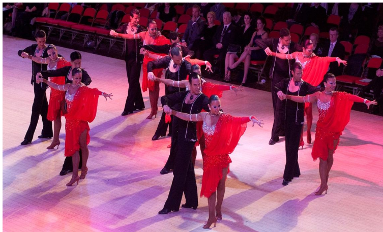
그림 4. 포메이션

포메이션 대형의 종류로는 다이아몬드, 정사각형, 대각선, 원, 선 등이 있으며 대형 변화는 신속하게 행해져야 하고 변화 후에는 정렬되어 있어야 한다.