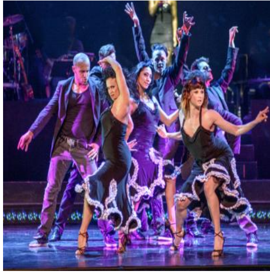
그림 6. 공연 1