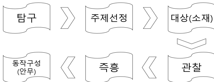
그림 1. 안무창작의 과정

권윤방(2009)에서 안무창작의 과정은 총 6단계로 <그림 1>과 같이 나뉜다.