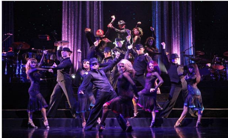
그림 7. 공연 2