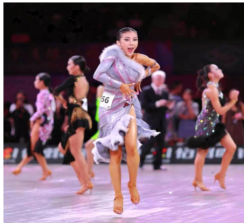
그림 3. 솔로(Solo)댄스

일 수가 있다. 솔로(Solo)댄스 경기 작품은 파트너 경기 작품에 비해 댄서 동작들의 흐름을 중요시해야 하며 혼자서도 충분히 가능한 동작들로 구성해야 한다. 또한 파트너랑 할 때에는 여성 댄서든 남성댄서든 뒤로 진행하는 동작들은 다른 한명의 댄서가 뒤를 봐주기 때문에 다른 선수들과 부딪히거나 동선을 방해받는 일이 없겠지만 솔로(Solo)로 뒤로 진행하는 동작을 진행하기에는 무리가 있을 것이다. 그러므로 뒤로 진행하는 동작은 시선은 뒤를 보거나 짧은 시간 안에 진행을 마무리해야 한다. 그 외에는 파트너 경기 댄스작품을 창작할 때와 같이 창작을 하며 혼자서 무대를 채워야하기 때문에 창조적이거나 독창적인 리액션 또는 제스처로 관객 또는 심사위원들에게 자신만의 개성을 보여줄 수 있는 동작들을 연구해야 한다.