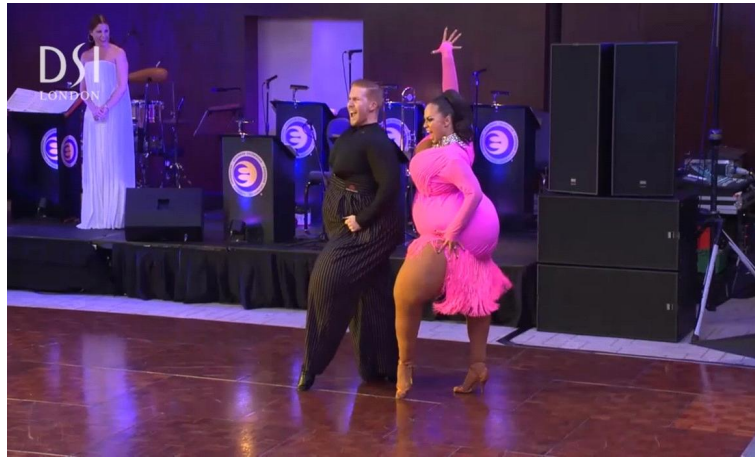
그림 9. 쇼댄스로 본 독창성1