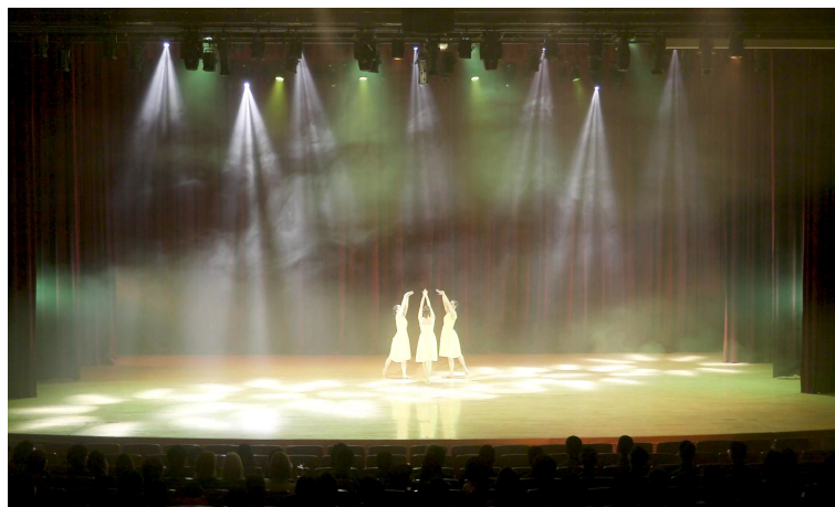
그림 14. 공연 중 『땅』

‘지 『地』’ 땅은 생명의 기본, 씨앗이 싹을 트고 나오는 모습을 표현하고 여성에 빗대어 여성의 자궁 속에서 나오는 하나의 생명을 축복하는 따뜻함을 가진 작품으로 많이 표현되었다. 생명이 태어난다는 것에 라틴댄스 종목인 차차차로 밝고 신남을 표현했으며 라틴댄스인 룸바와 스탠다드댄스인 왈츠 또는 비엔나 왈츠를 조합시켜 Perfect - Lowell Yeary 음악에 맞춰 새싹이 피어나는 모습을 비유한 동작들과 함께 라인을 더 길게 보여주며 마치 새싹이 자라나는 듯한 설렘과 따뜻함을 느끼게 해준다. 그에 맞게 조명도 노란색을 주로 사용하였다.