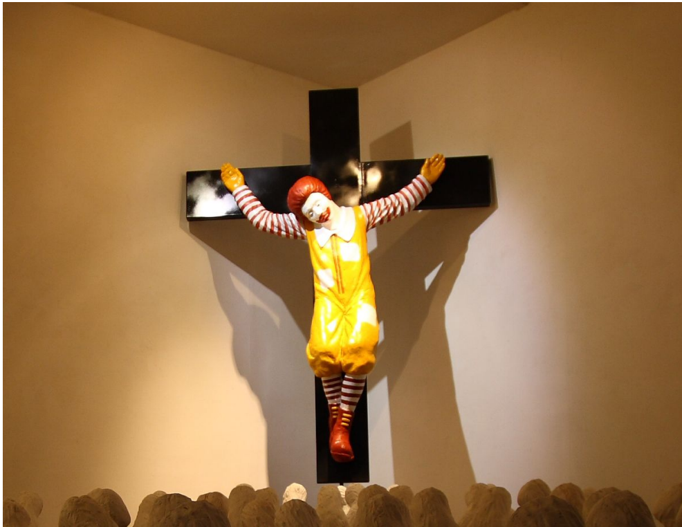
(도판3) 작 품 『맥도널드』 , 1,800×500×2,500mm , 2008 FRP , steel에 채색