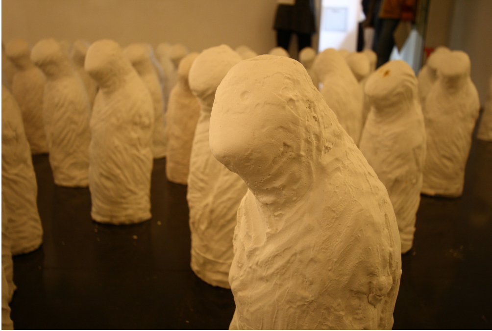
(도환2) 작 품 『TRANCE』 가변크기, 석고 2008