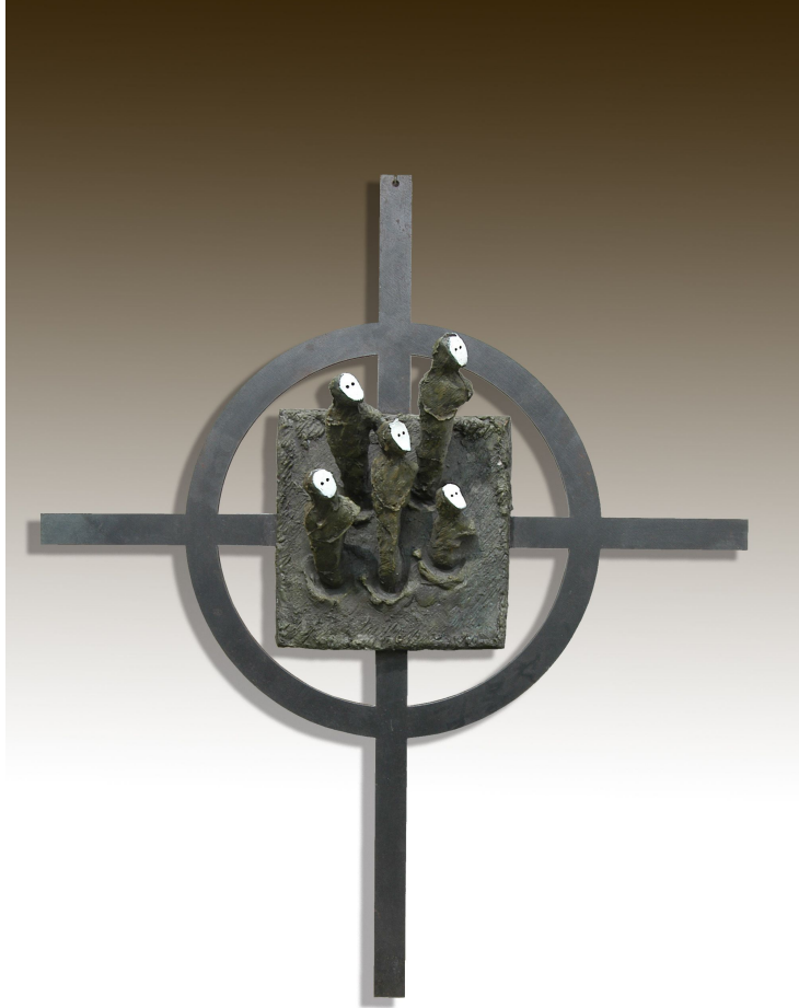
(도판4) 작 품 『바라보기』 , 750×880×150mm , 2008, FRP ,steel