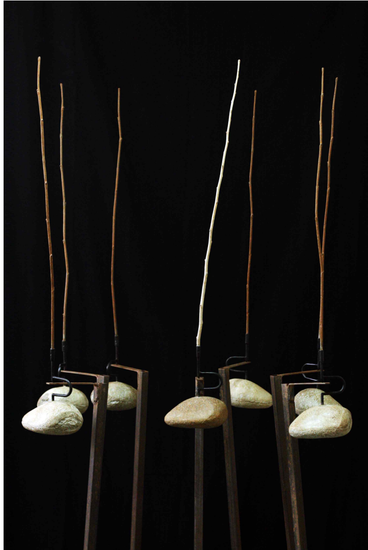
【작 품 4】 nature in the city #4