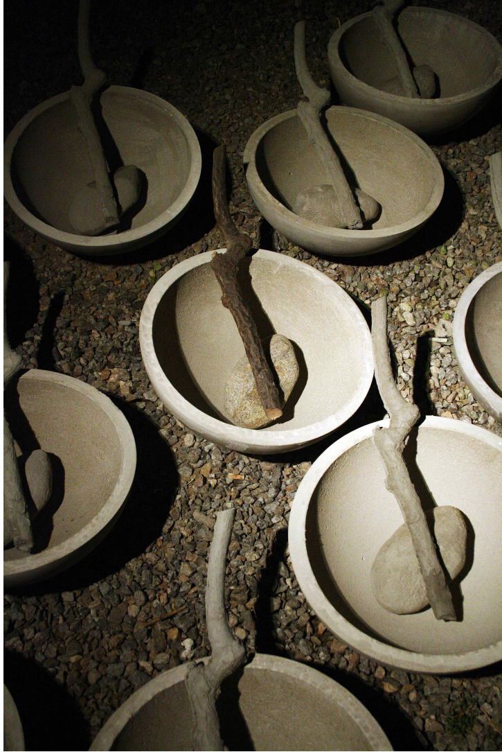
【작 품 3】 nature in the city #3