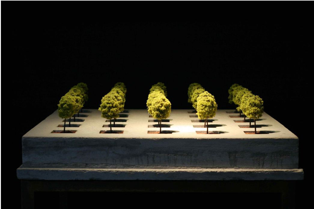
【작 품 1】 nature in the city #1