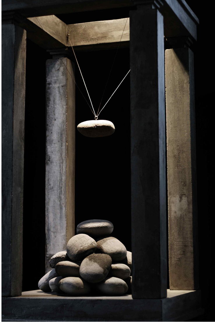
【작 품 2】 nature in the city #2