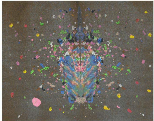
<도판 14> 밤의 불꽃 놀이