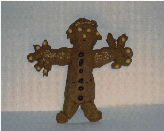
<도판 10> 나