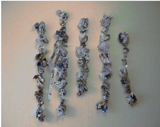
<도판 7> 눈오는 날