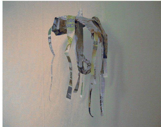
<도판 8> 우산