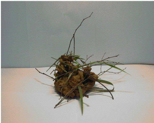
<도판 3> 비둘기집