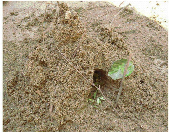
<도판 5> 인디언집