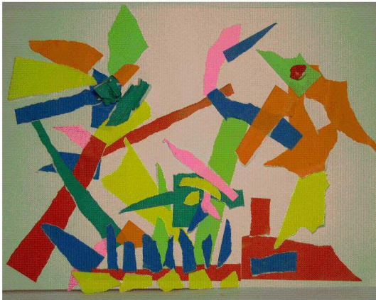
<도판 13> 기차 불꽃 놀이