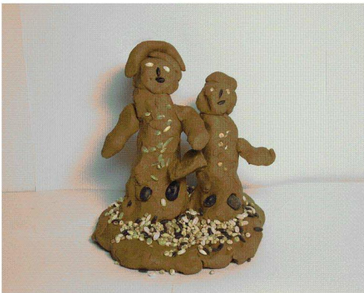
<도판 12> 엄마와 나