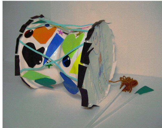
<도판 17> 장구