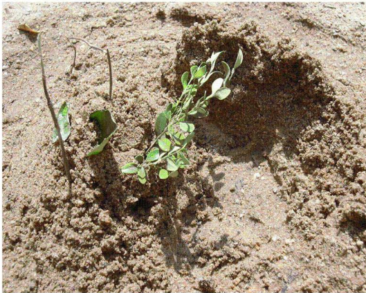
<도판 4> 산