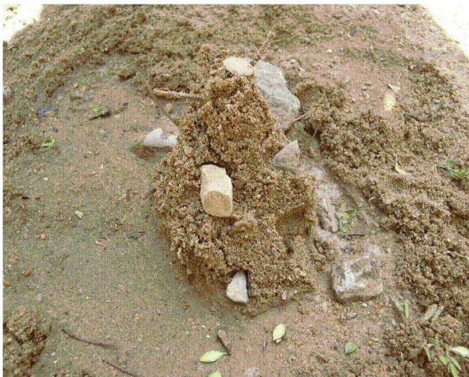
<도판 6> 소라