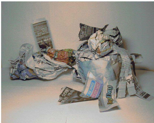
<도판 9> 물고기(상어)