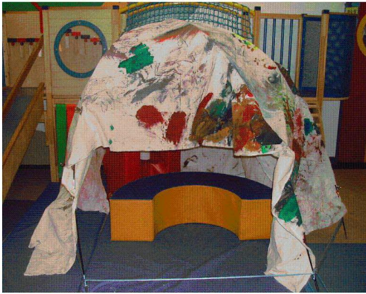
<도판 1> 사슴집