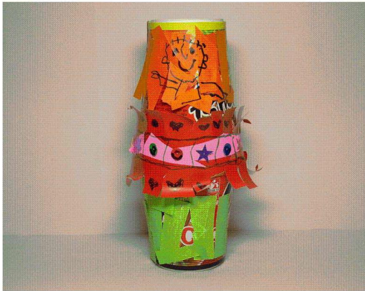
<도판 16> 마라카스