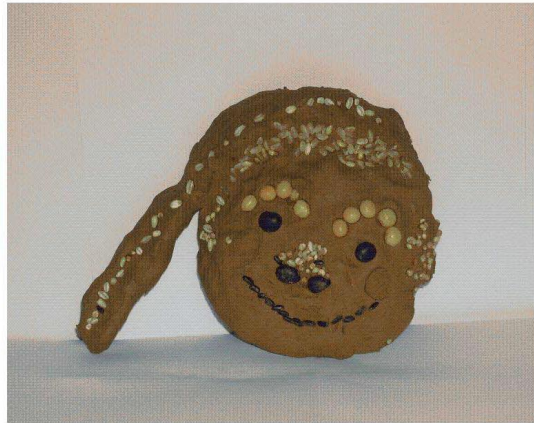
<도판 11> 웃는 나