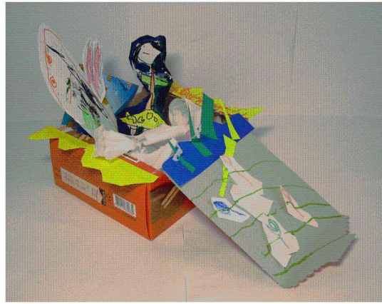
<도판 2> 토끼집