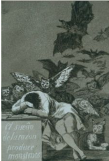
[도판 1] 고야, <이성의 잠은 괴물을 낳는다>, 1797-1799