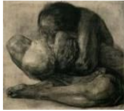
[도판 14] 케테 콜비츠, <죽은 아이를 안은 여인>, 1903

안의 감정이 확장되면 삶 전반의 감정을 점차 지배해 허무하고 우울한 상태로 빠지게 된다.