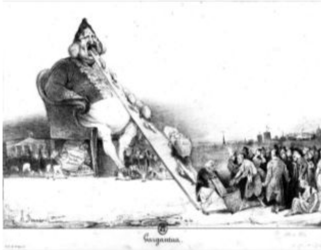
[도판 9] 오노레 도미에, <가르강튀아>, 1831

도미에(Honoré Daumier, 1808~1879) 38) 역시 당시 생활상을 보여주는 리얼리스트였다. 특히 도미에는 풍자화로 이름을 날렸는데 풍자화를 그리던 그에게 미술이란 아무리 곱고러워도 진실 그대로 비춰야하는 거울이차 시대의 증거로의 의미를 지녔다. 그는 스스로 시대의 기록자를 자처하며 모