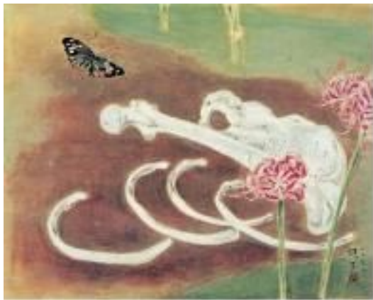
[도판 6] 천경자, <내가 죽은 뒤>, 1952