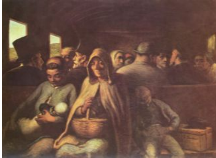
[도판 10] 도미에, <삼등열차>, 1864