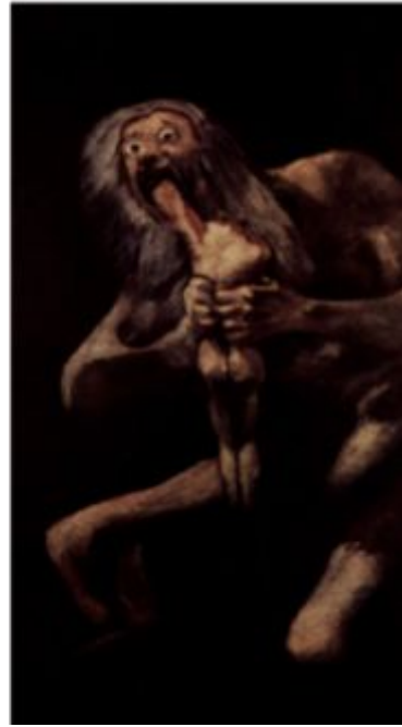
[도판 2] 고야, <아들을 잡아먹는 사투르누스>, 1823

실험적으로 혼합한 80점의 동판화로 이루어진 판화집에는 고야 스스로 ‘인간의 과오와 악덕에 대한 비판’을 목적으로 한다고 하였다.[도판 1] 이러한 사실은 그가 몸담고 있는 현실로부터 역사적인 거리감을 확보하고 스스로를 볼 수 있었다는 것을 뜻한다. 또한 그는 ‘검은 그림’ 시리즈를 통해 시대와 자신과의 괴리감을 표출했다. 성공가도를 걷던 궁중화가가 가진 사회적 지위와 그가 살던 시기와 내면의 갈등을 표현하는 작업으로 이어졌다. 특히 <아들을 먹어치우는 사투르누스>[도판2]에서 보여지는 광기어린 모습은 내면의 불안, 갈등이 극적으로 표현된 작품이다. 그는 이 내면의 갈등으로 인해 새로운 시각으로 전통을 해체하고 새로운 의미를 생산하고 있다고 말할 수 있다.