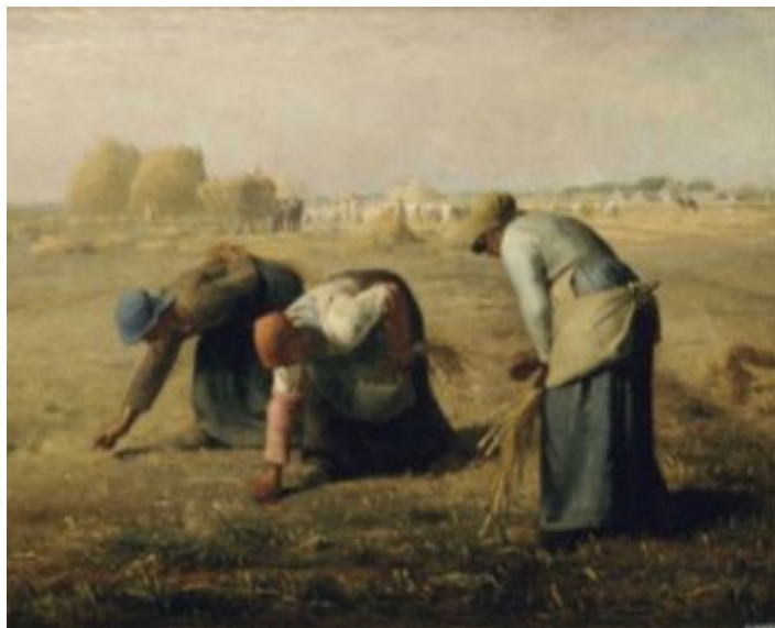
[도판 11] 밀레, <이삭줍기>, 1857