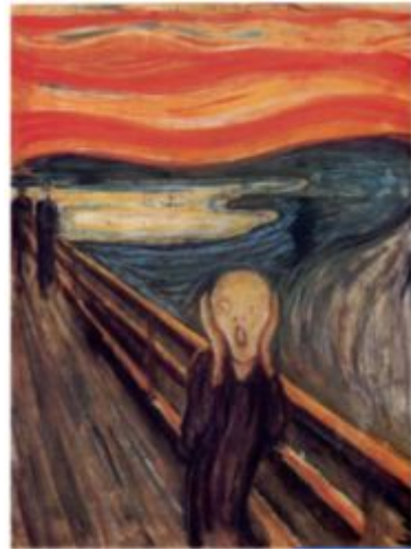
[도판 4] 몽크 <절규>, 1893

으로 인해 내면에 잔존하고 있는 감정들을 형상화하였다. 이러한 모티프들 내면의 감정적인 측면과 정신적인 측면에 대한 자신의 경험을 그림에 표현하였다. 특히 <절규>[도판4]라는 제목을 가진 그림은 갑작스런 정신적 동요가 우리의 모든 감각적 인상을 어떻게 변화시키는가를 표현하는 데 역점을 두고 있다. 소리를 지르고 있는 사람의 얼굴은 비현실적으로 과장되어 있으며 둥그렇게 뜬 눈, 흘쭉한 뺨은 죽은 사람의 얼굴을 연상시킨다. 또한 뒤에 있는 사람들은 이 절규에