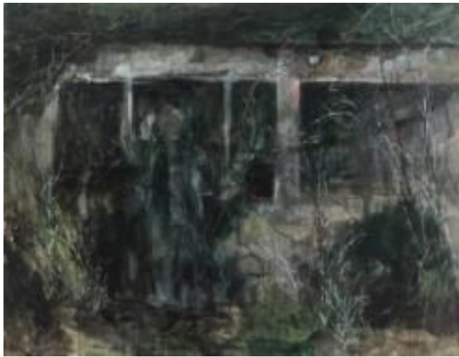
[작품 2] 얼굴없는 너에게, 2013, 종이에 채색, 112×145cm