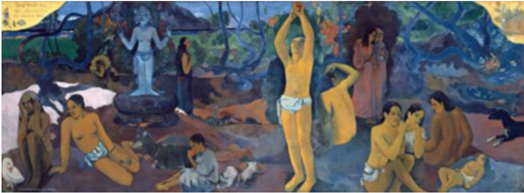
[도판 3] 폴 고크, 우리는 어디서 왔는가, 우리는 무엇인가, 우리는 어디로 가는가, 1898

우리가 그림을 그리는 상황뿐 아니라 삶이라는 공간 속에서 계속 질문하게 되는 근원적인 질문이다. 고크는 자신의 근원을 찾는 물음에서 시작되어 자신의 현재를 고민하며 앞으로 나아갈 미래를 두려워하고 불안해하는 가장 근원적이고 태생적인 고민을 지속적으로 하고 있었던 것이고 그 과거와 현재를 돌아보며 갖는 감정은 미래에 대한 물음이자 불확실함에 대한 불안이었다. 고크의 이런 모습은 후대의 화가들에게 귀감이 되었으며 그들이 겪게 되는 사회적 상황 속에서 외부에 휩쓸리지 않고 자신의 내면과 감정에 집중하는 법을 알려주었다.