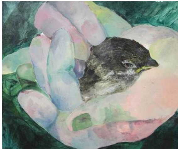
[작품 4] 평화, 2013, 종이에 채색, 60×72cm