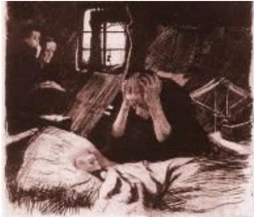
[도판 5] 콜비츠, <궁핍>,1893