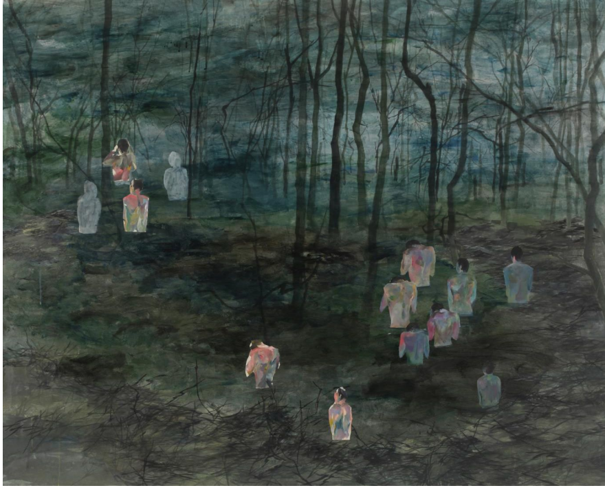
[작품 3] 서른 살의 봄, 2013, 장지에 채색, 130×162cm,