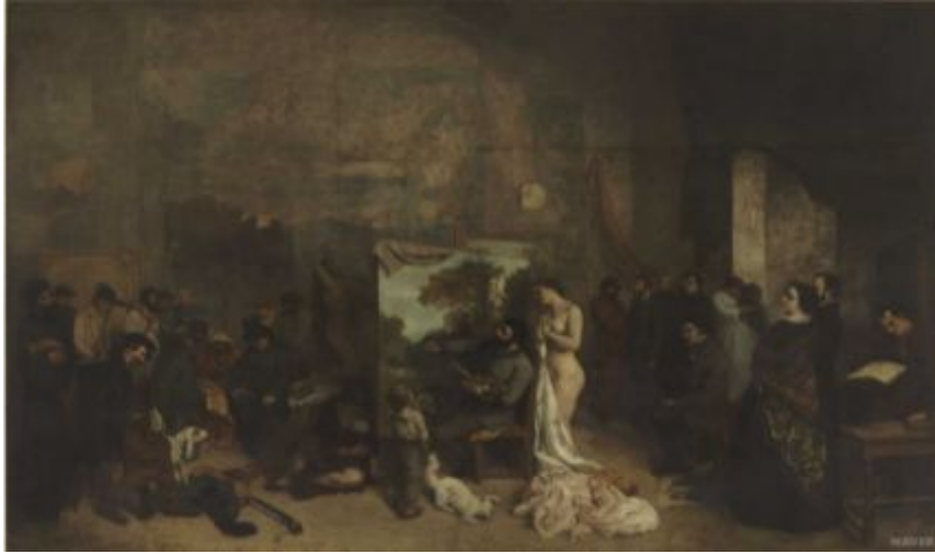
[도판 7] 구스타프 쿠르베, <화가의 작업실>, 1855