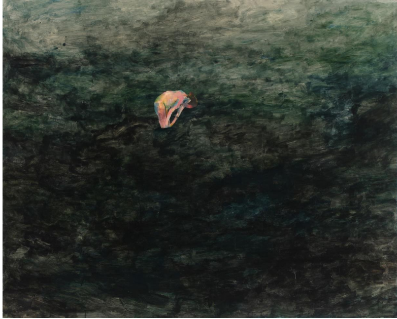
[작품 6] 깊지않은 물, 2013, 종이에 채색, 130×162cm