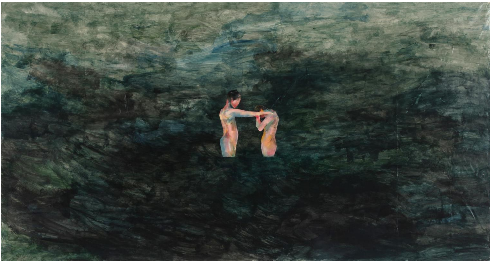
[작품 7] 말없는 대화, 2013, 종이에 채색, 89.5×169cm