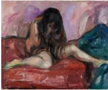
[도판 13] 뭉크, <흐느끼는 누드>, 1914