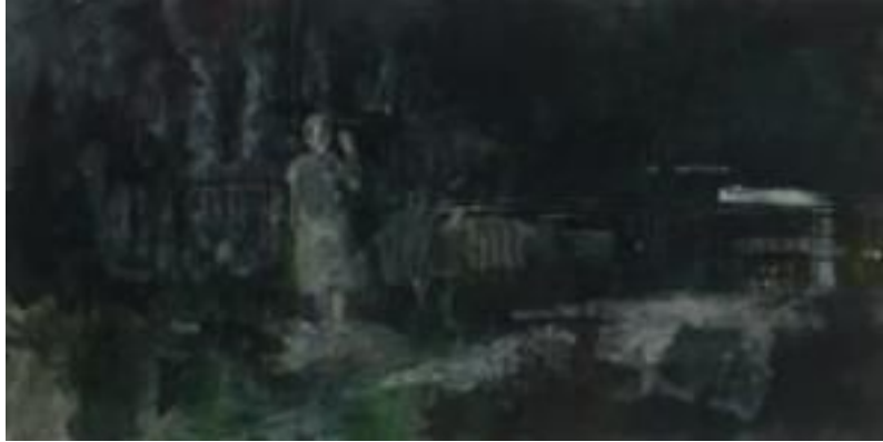
[작품 1] 이름없는 너에게, 2013, 종이에 채색, 50×90cm