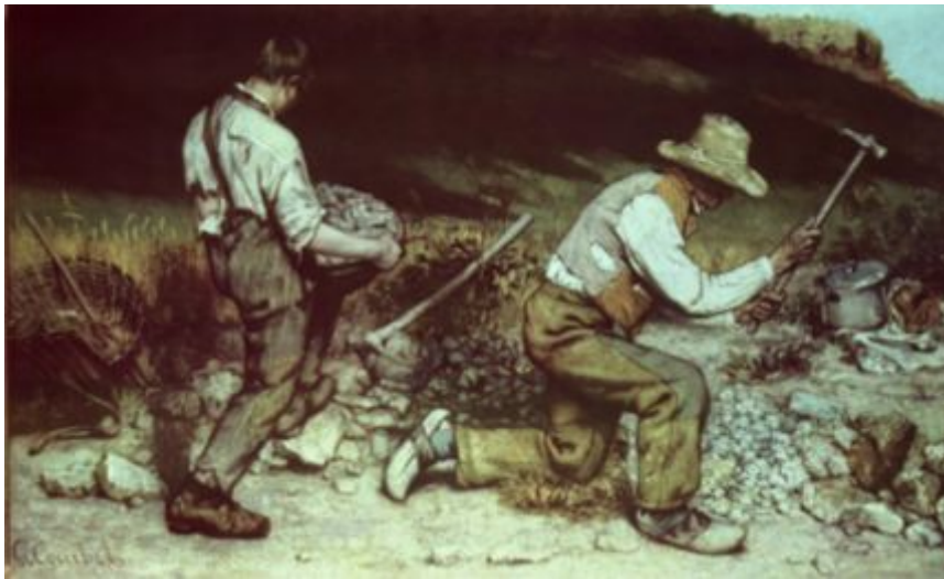
[도판 8] 구스타프 쿠르베, <돌깨는 사람들>, 1850