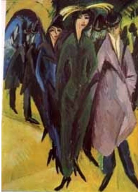
[도판1] 키르히너, 거리의 여자들, Oil on canvas, 131x158cm 1913