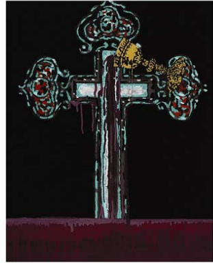
고린도전서11:23-26, 91.5x73cm, 장지에 분채, 2010