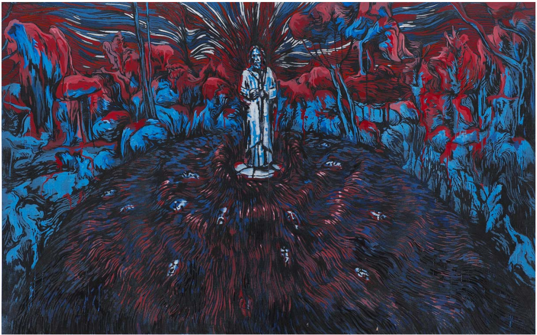
시편34:15-19, 260.6x324.6cm , 장지에 분채, 목탄, 2010