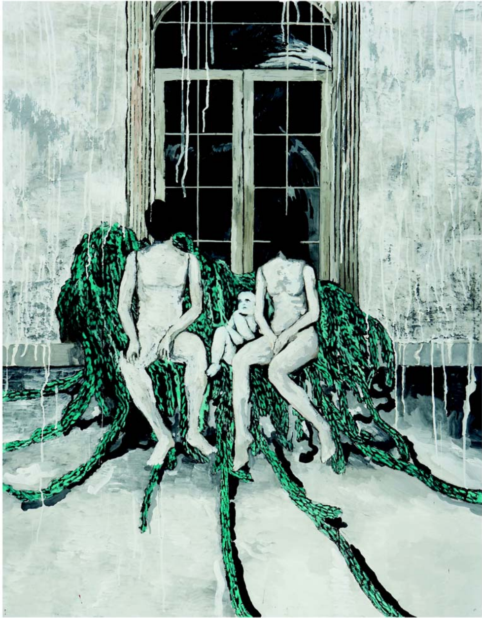
The Psalm(시편)121:5-8 장지에 분채 162.3x130.3cm,2010