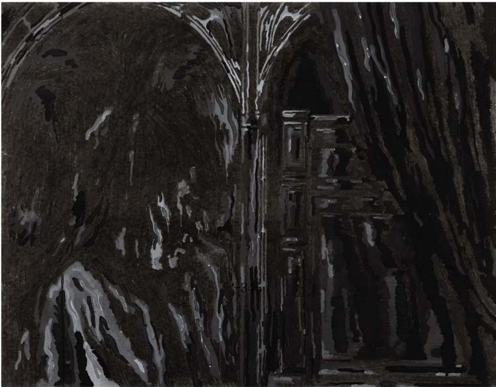
Matthew(마태복음)18:18 장지에 분채 91x117cm,2010