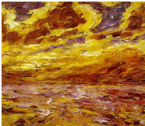
[도판2] 에밀 놀데, 오트만의 바다, Oil on canvas, 30x35, 1910