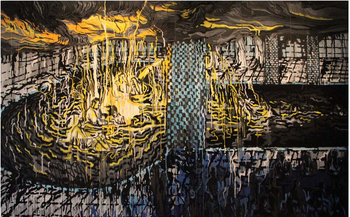
마가복음 28:19, 260.6x324.6cm 장지에 분채, 2010