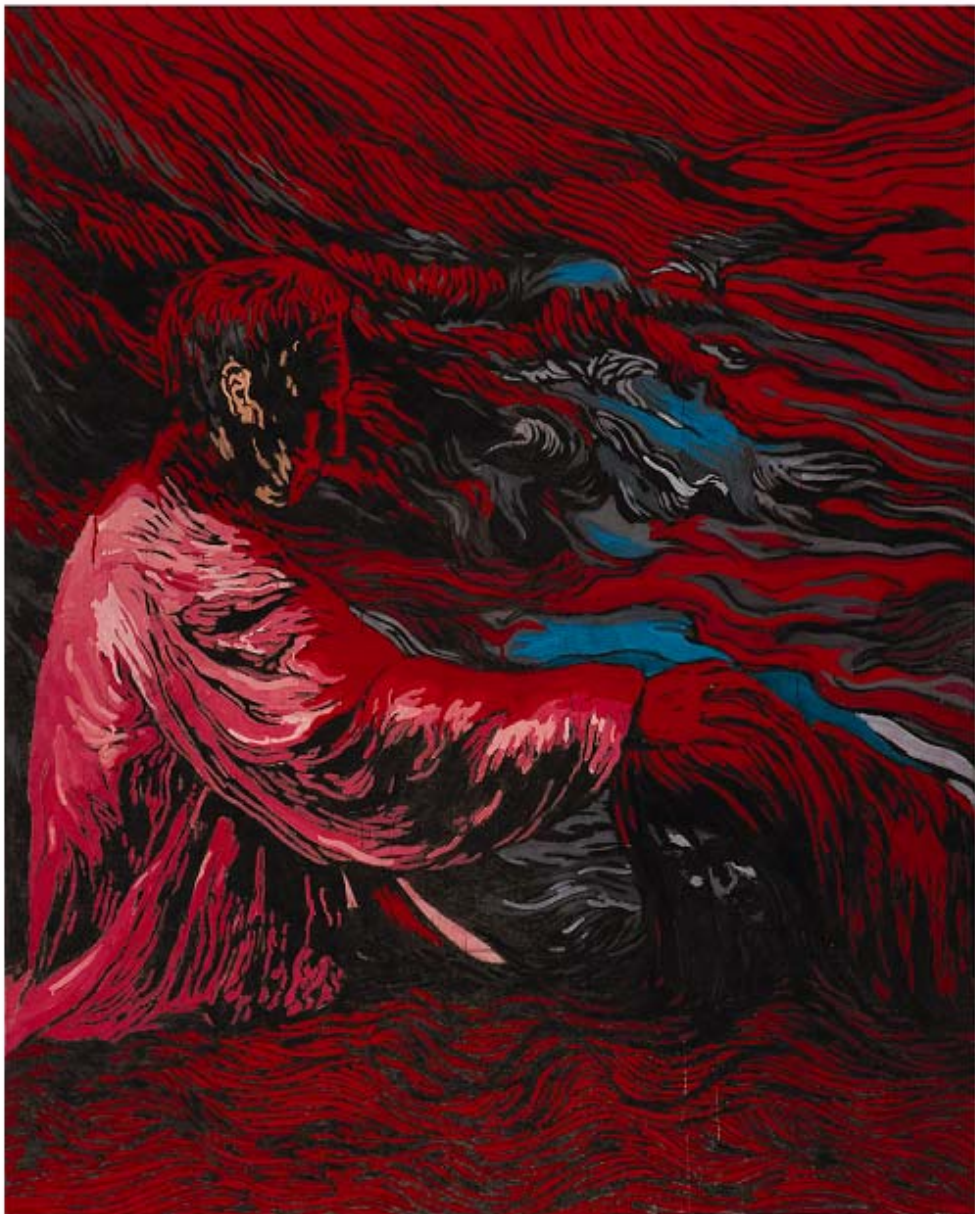
Luke(누가복음)3:3-6,8 장지에 분채 162.3x130.3cm,2010