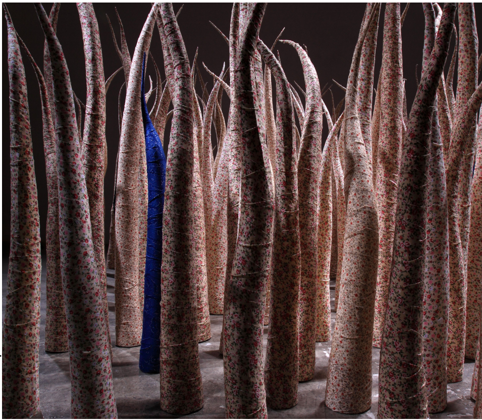
【작품 1】 Dreaming....., 가변크기, 혼합재료, 2010