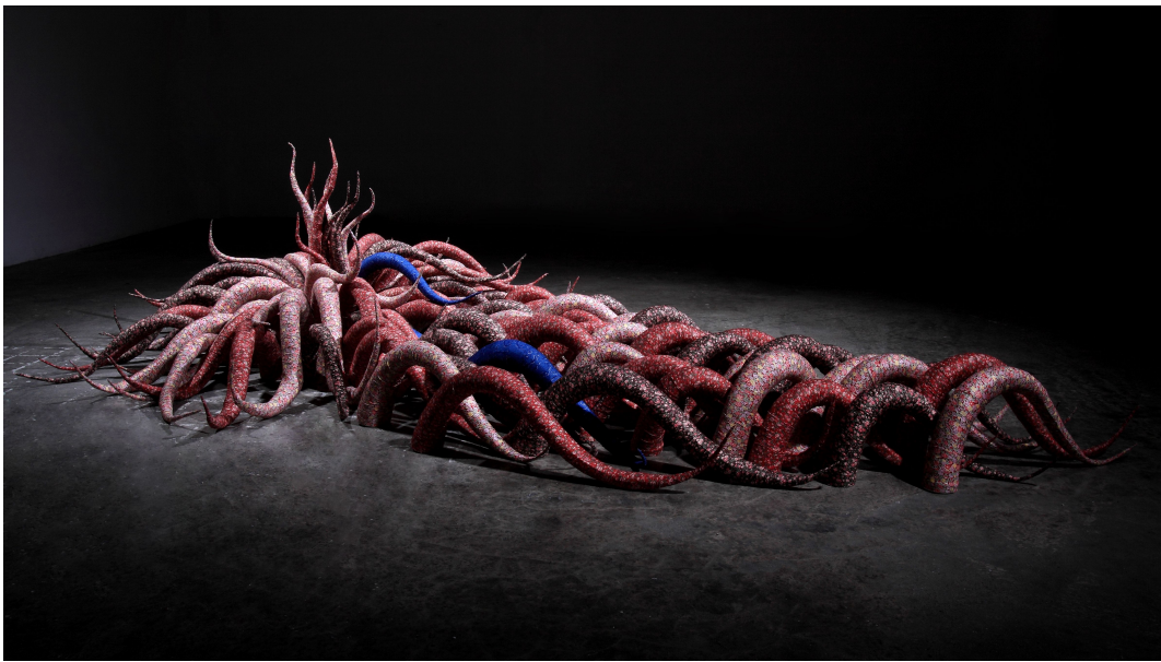
【작 품 2】 Dreaming....., 가변크기, 혼합재료, 2010