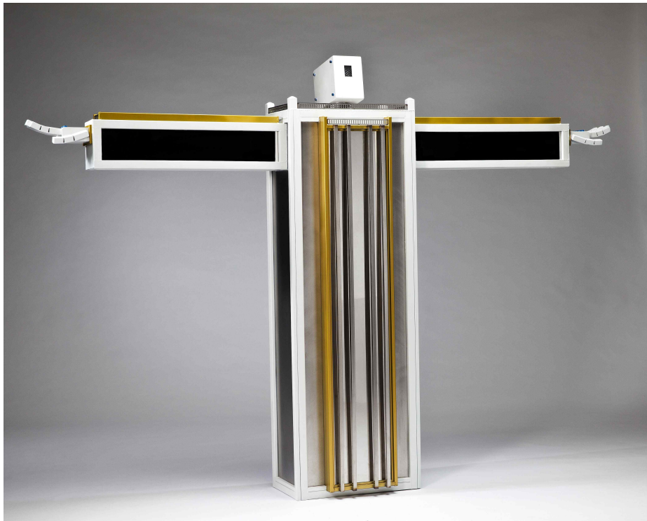
【작품 6】 +