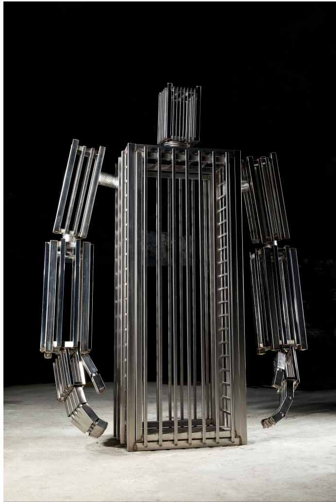
【작품 7】 CITY