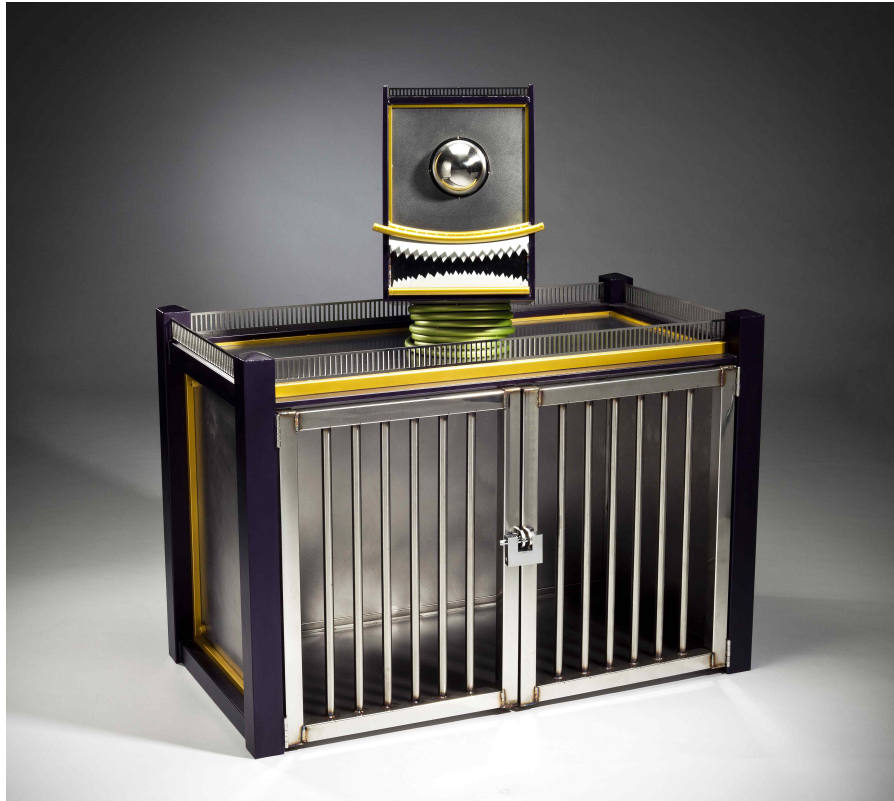
【작품 2】 도시감옥