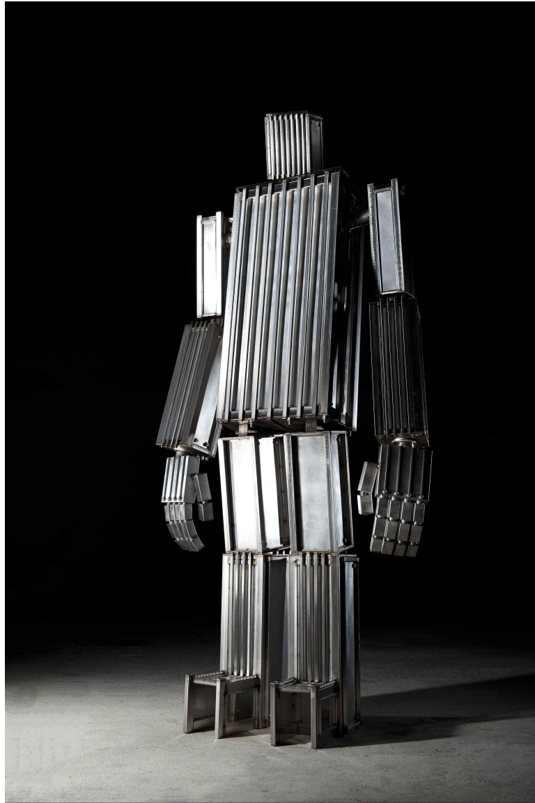
【작품 1】 도시괴물