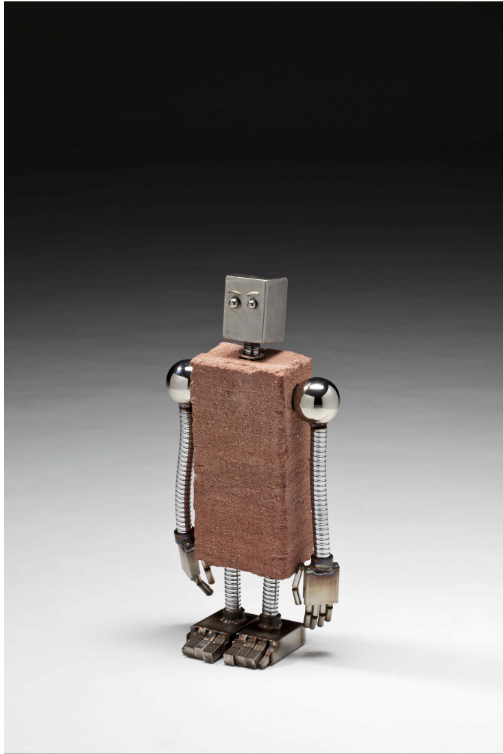
【작품 3】 노예 시리즈