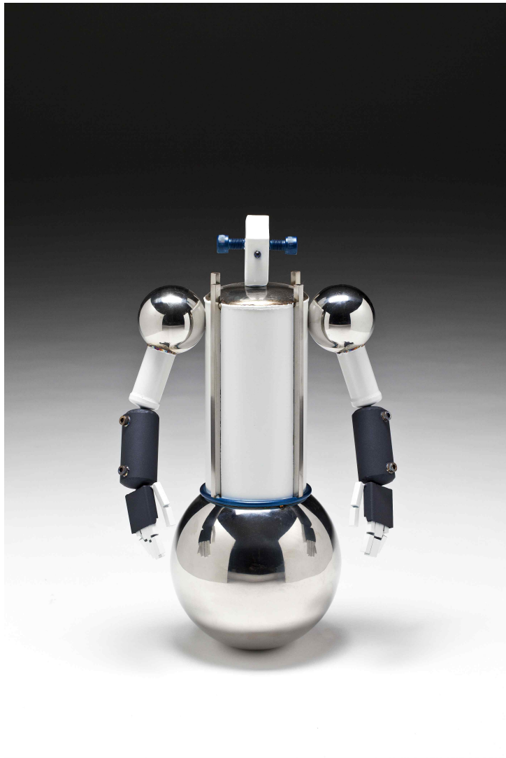
【작품 4】 외눈박이