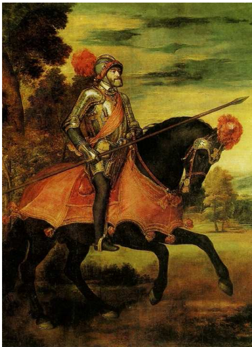
[도판10] 「황제의 기마상」, 1548년, 캔버스에 유채, 332x279cm, 마드리드, 프라도 미술관