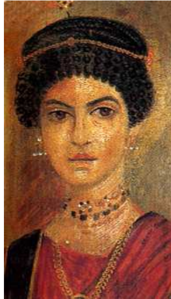
[도판2] 「보석으로 치장한 젊은 여인 파이움의 공동묘지, 2세기경」,