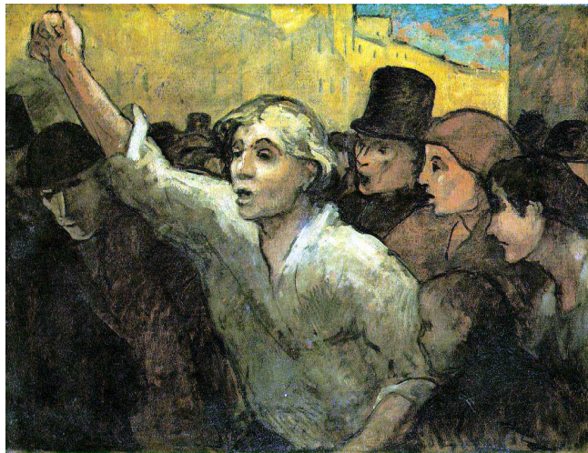
[도판18] 「폭동(반란)」, 1848~49, 50년대