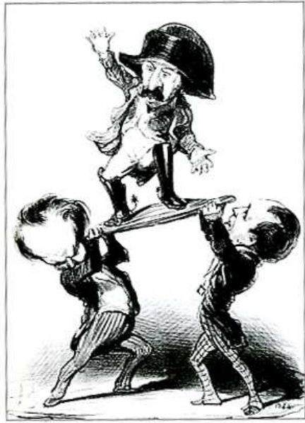
[도판12] 「빅토르 위고와 에밀 자르맹은 루이 왕자를 받들고자 하나 받침이 시원찮다」, 1848년, 석판화