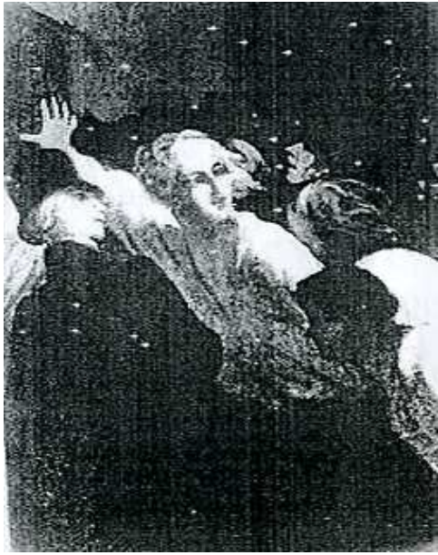
[도판16] 「반란」, 1848년