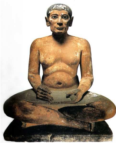
[도판1] 「가부좌의 서생」, 고대 이집트, 기원전 2500년경