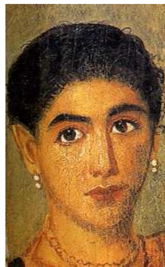
[도판4] 「젊은 여인의 초상」, 파이움의 공동묘지, 2세기경