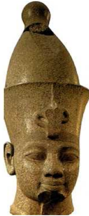
[도판6] 「아멘호프 3세의 두상」, 6세기