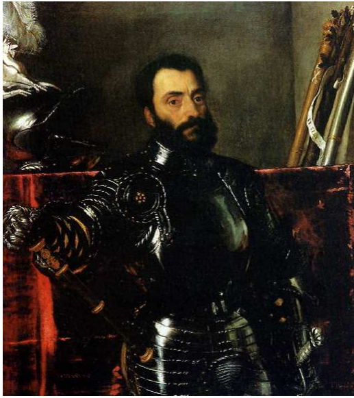
[도판8] 「프란체스코 곤차가」, 1536~38년, 캔버스에 유채, 114x100cm, 우피치 미술관