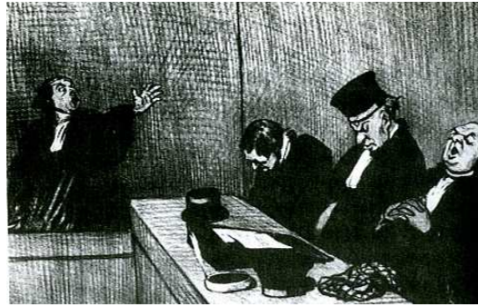
[도판13] 「줄고 있는 판사들」, 1845년, 석판화