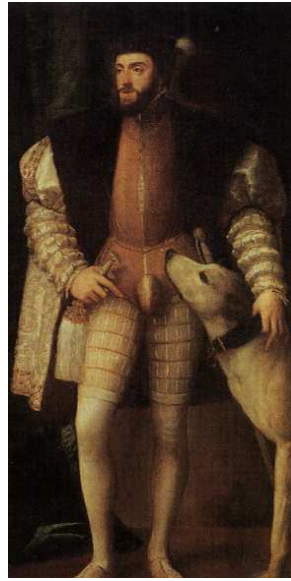
[도판9] 「황제 카를 5세」, 1532~33년, 캔버스에 유채, 192x111cm, 마드리드, 프라도 미술관