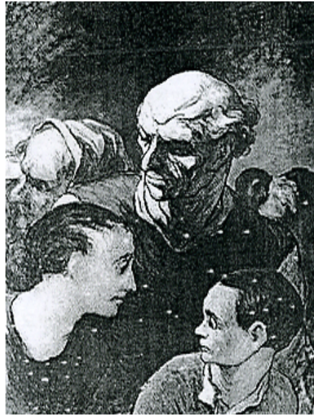
[도판17] 「바리케이트 위의 가족」, 1848년