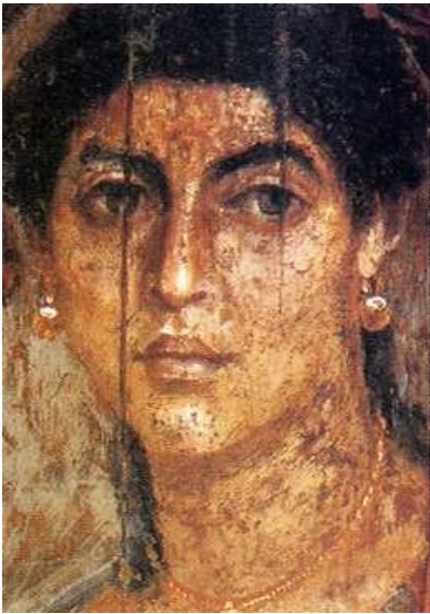
[도판3] 「아름다운 베네치아 여인」, 파이움의 공동묘지, 2세기경