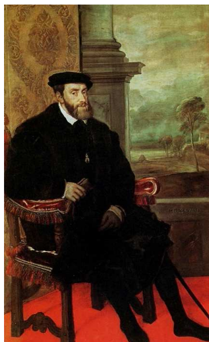
[도판11] 「황제 카를 5세」, 1548년, 캔버스에 유채, 205x122cm, 뮌헨 미술관