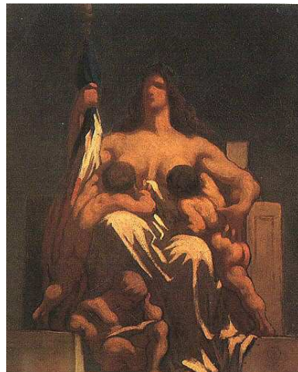
[도판15] 「공화국」, 1848년, 캔버스에 유채, 75x60cm, 파리, 오르세 미술관