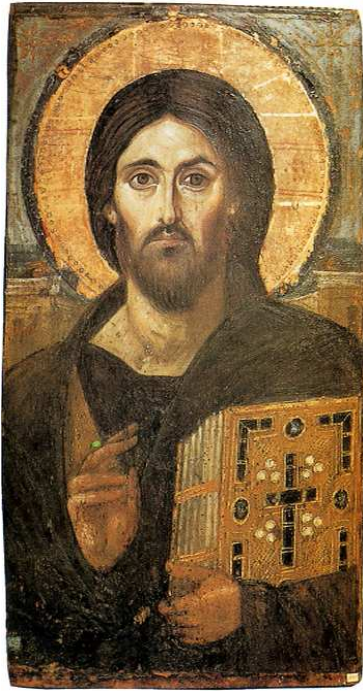
[도판5] 「판토크라토스 그리스도」, 기원전 1355년경