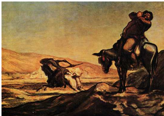
[도판14] 「풍차에 돌격하는 돈키호테」, 1866년경 캔버스에 유채, 56x84cm, 뉴욕, 개인소장