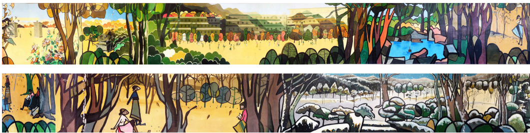
<도판 2> 무학여고 도서관 건물 벽화 그림

사회교육시설들은 지역의 환경을 보다 더 생각하여 아름답고 안전하며 살기 좋은 곳으로 변화시키며 지역민의 자부심을 높여주어 생활에도 긍정적인 변화를 가져오게 된다. 많은 지역 교육시설들 중에 대표적인 공공도서관은 지역 주민들에게 문화행사와 친교의 장으로 사용된다.