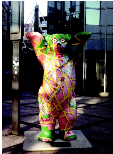
<도판 4> 베를린 시 길거리에 있는 곰 지도

버스 쉼터는 도시와 도시를 연결하는 기능적 플랫폼이자 도시의 공간과 공간을 문화요소로 연결하는 커뮤니케이션의 공간이다. 따라서 가로환경에서 기능적 가치를 제공함과 동시에 환경과 사람 사이에서 원활한 소통의 공간으로 자리 잡아야 한다. 소통과 통합이야말로 다양한 사회구성원들을 아우르는 진정한 공동체 지향적 개념이다. 도시의 공공디자인 또한 차이를 인정하고 다름을 수용하는 문화적 다양성에 의해 공공적 가치를 발견할 수 있다.