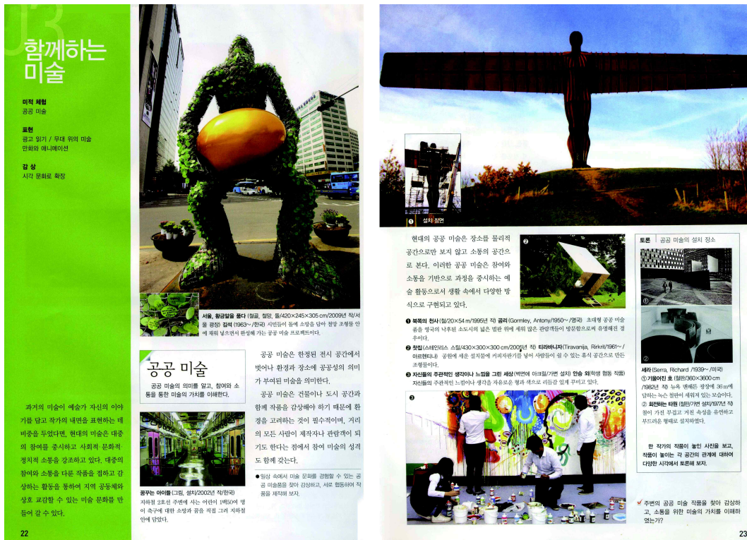
<도판 6> 교학사 미술교과서-함께하는 미술

미술은 사람의 정서를 가장 직접적으로 표현할 수 있는 예술이며, 지역과 문화와 시대가 달라도 어느 곳에서나 소통될 수 있는 마음의 언어이다. 교학사의