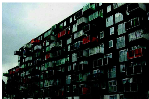
<도판 5> 다양한 형태로 지어진 아파트

소비자들에게 이전과 다른 삶의 기회를 제공해 온 것이 사실이다. 그중에서도 주택이란 큰 환경을 대상으로 확산시킨 국가가 한국이며 특히 대량생산의 전형