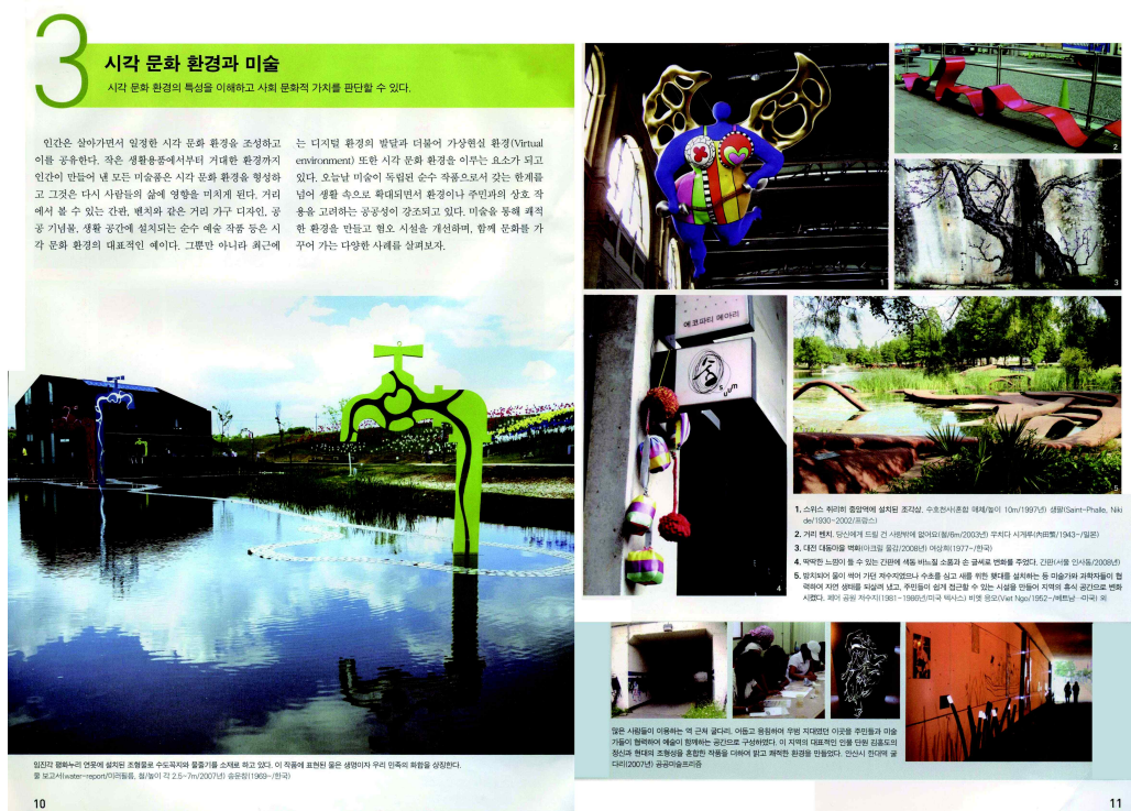
<도판 7> 미진사 미술교과서-시각 문화 환경과 미술

미진사의 미술교과서에서의 공공미술의 분야는 각 대단원마다 하나의 소단원 이상으로 공공미술의 이론내용과 실기활동을 다루었다. 첫 번째 대단원 ‘환경, 인간 그리고 미술’에서는, ‘자연환경과 인간의 미의식’, ‘자연 생태 속 미술’, ‘시각 문화 환경과 미술’로 우리의 주변에서 쉽게 보며 느낄 수 있는 자연과 연관한 공공미술에 대해 구성되어있다. 자연의 다양한 모습에서 조형의 요소와 원리를 발견하고 그 아름다움을 이해할 수 있도록 자연을 관찰하는 방법에 대한