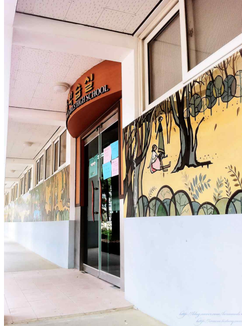
<도판 3> 무학여고 도서관 건물 벽화 적용 사진

사회교육시설들은 지역의 환경을 보다 더 생각하여 아름답고 안전하며 살기 좋은 곳으로 변화시키며 지역민의 자부심을 높여주어 생활에도 긍정적인 변화를 가져오게 된다. 많은 지역 교육시설들 중에 대표적인 공공도서관은 지역 주민들에게 문화행사와 친교의 장으로 사용된다.