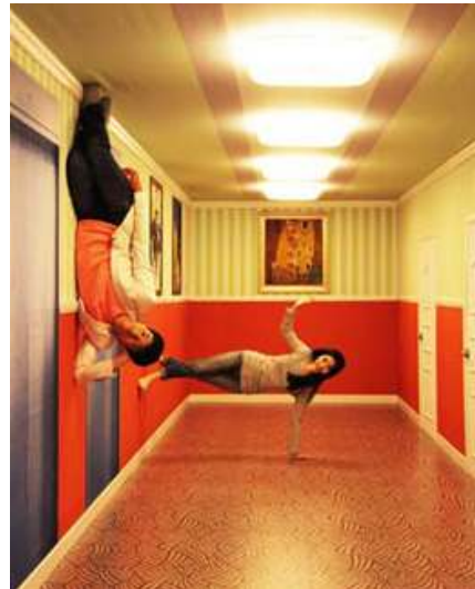
<도판 1> 트릭아트 전시장

트릭아트란 2차원(평면)의 작품을 3차원(입체)로 표현한 초리얼리즘 예술로서 벽면, 바닥면, 천정 등에 역사적 명화, 조각 또는 동식물 등을 투명도가 높은 특