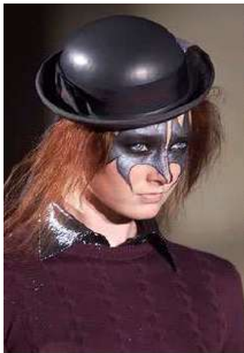
<그림 88> 반항성 7 (2002 F/W Alexander McQueen )