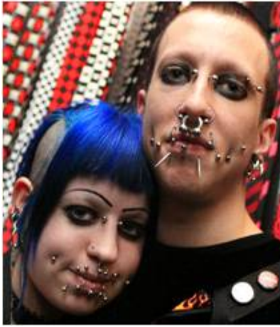
<그림 5> 퍼키 코스 1