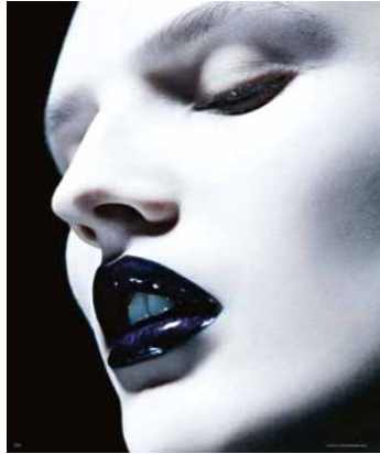
<그림 36> 관능성 1 ( http://cafe.naver.com/ydp-at3323/140 2013, 11, 12 검색)