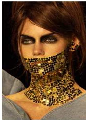
<그림 47> 관능성 12 2013 F/W (Michael van der Ham www.style.com)