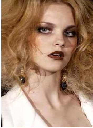
<그림 44> 관능성 9 (2004 S/S Valentino)