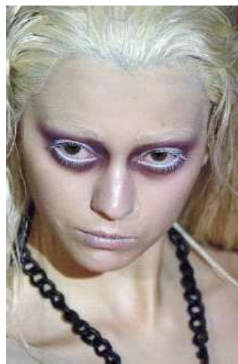
<그림 71> 비애성 12 (2006 S/S Christian Dior www.style.com)