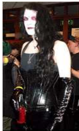
<그림 16> 트랜스 코스 4 ( http://www.ciphergoth.org 2013, 10, 15 검색)