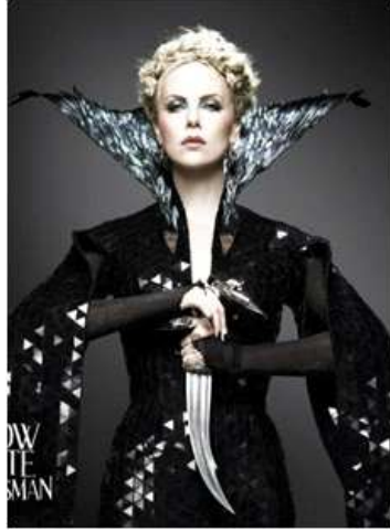
<그림 1> 트레이드 코스 1 ( http://blog.naver.com/PostView.nhn?blogId=goldsunriver&logNo=90128085454 2013, 10, 15 검색)