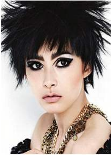
<그림 86> 반항성 5 ( http://www.breaknews.com/sub_read.html?uid=296288 8 2013, 11, 25 검색)