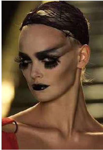
<그림 68> 비애성 9 (2003 S/S Christian Dior www.style.com)