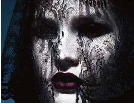
<그림 60> 비애성 1 ( http://cafe.naver.com/ydpat3323/140 2013, 11, 19 검색)