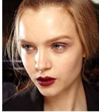
<그림 34> 뱀파이어 메이크업 4 ( www.google.com )