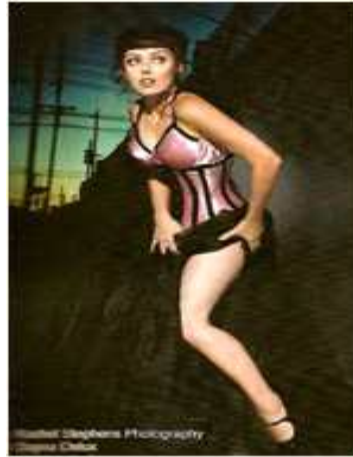
<그림 10> 페티시 코스 1 ( Gothic Beauty issue 22, p.29.)