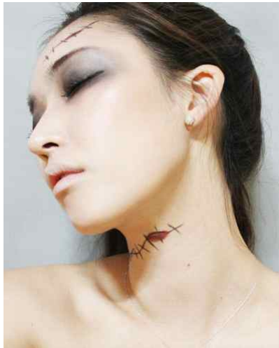
<그림 62> 비애성 3 ( http://blog.naver.com/dytlhdzk?Redirect=Log&logNo=169237545 2013, 11, 19 검색)