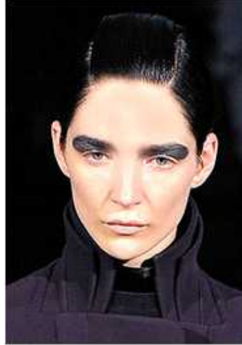
<그림 65> 비애성 6 (2013 F/W John Galliano www.style.com )