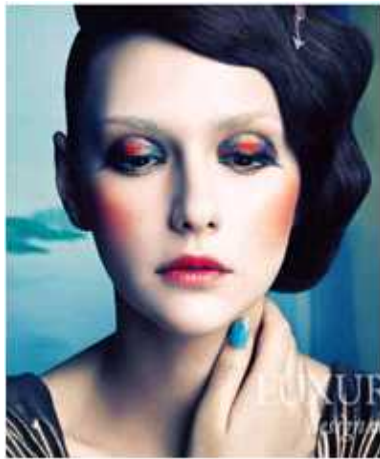
<그림 27> 서리얼리즘 메이크업 1 ( http://www.design.co.kr/section/news_detail.html?info_id=56327&category=000000020003 2013, 11, 30 검색)