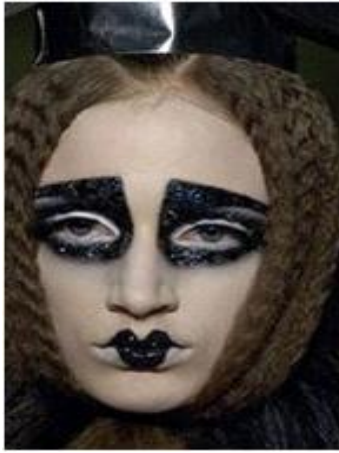
<그림 29> 서리얼리즘 메이크업 3