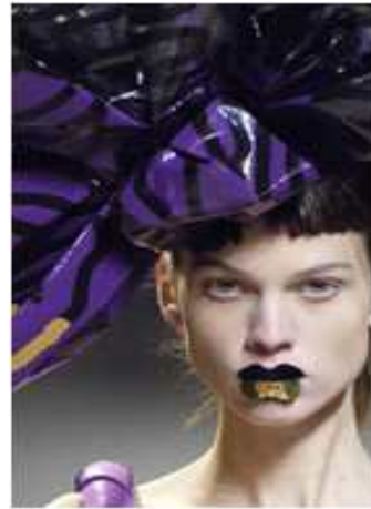
<그림 28> 서리얼리즘 메이크업 2 ( http://blog.daum.net/artis-tjbi/11297064 2013, 11, 30 검색)