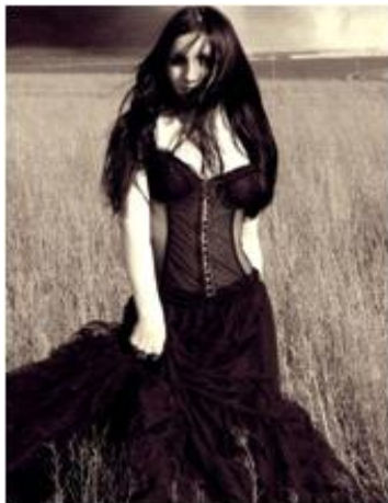
<그림 11> 페티시 코스 2