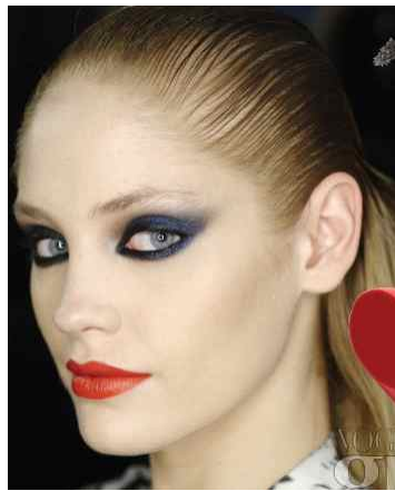
<그림 38> 관능성 3 ( http://www.style.co.kr/beauty/b_view.asp?menu_id=01070101&c_idx=010000000000200 2013, 11, 09 검색)