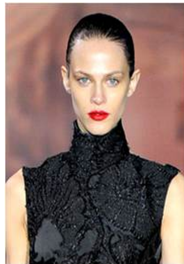
<그림 55> 여성성 8 (2011 F/W Giles www.style.com)