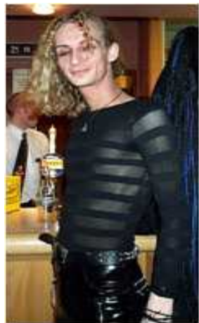
<그림 15> 트랜스 코스 3 ( http://www.ciphergoth.org 2013, 10, 15 검색)