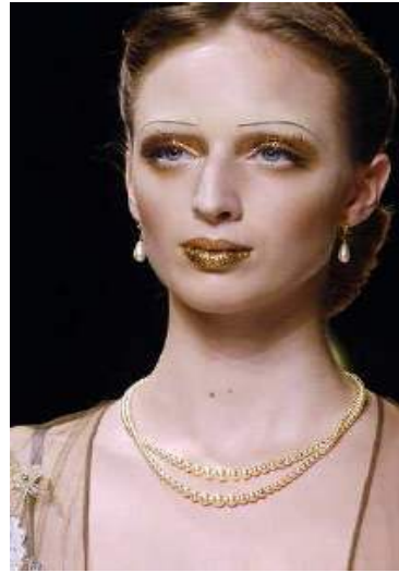
<그림 41> 관능성 6 (2006 S/S John Galliano www.style.com )