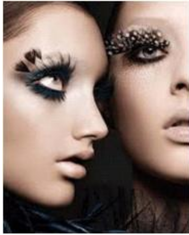
<그림 25> 데테스테 메이크업 1