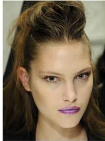
<그림 77> 모던성 6