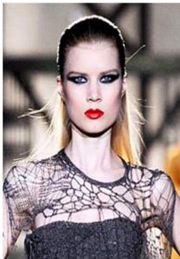
<그림 54> 여성성 7 (2010 F/W Dsquared2 www.style.com)