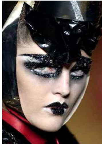
<그림 89> 반항성 8 (2006 F/W Christian Dior www.style.com )