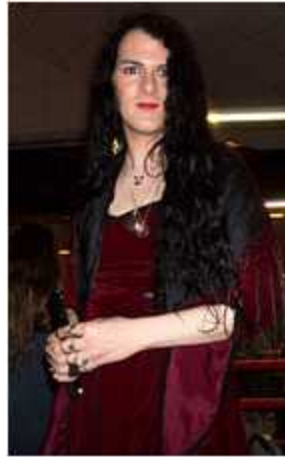
<그림 14> 트랜스 코스 2 ( http://www.ciphergoh.org 2013, 10, 15 검색)