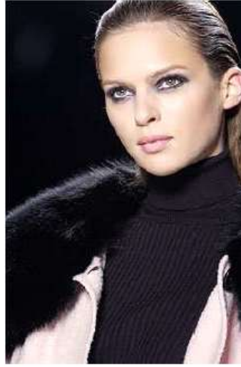
<그림 73> 모던성 2 (2003 F/W CELINE www.style.com )