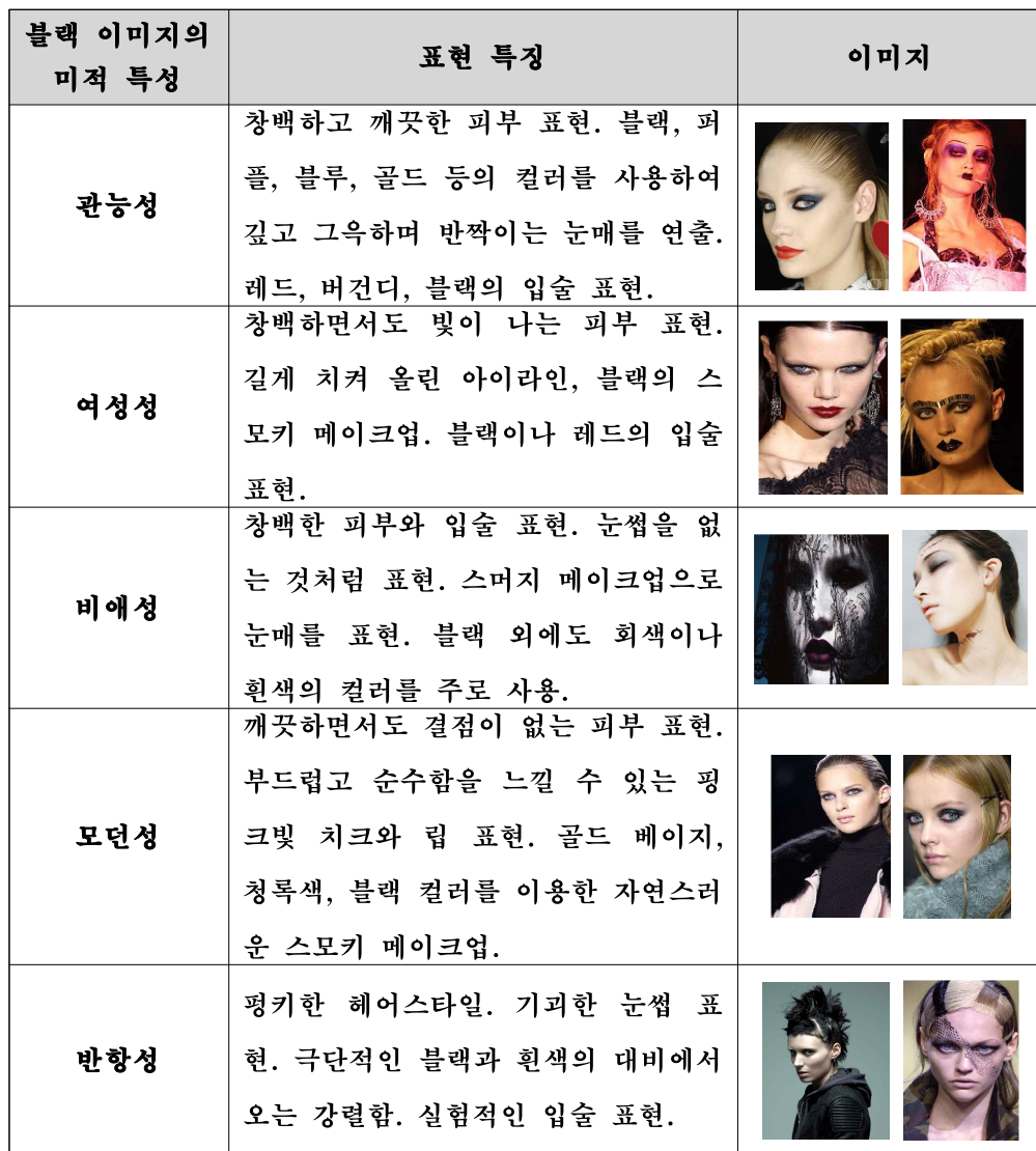
<표 3> 고스 메이크업에 나타난 블랙 이미지의 미적 특성

앞서 살펴본 고스 메이크업에 나타난 블랙 이미지의 미적 특성을 <표 3>으로 정리하였다.