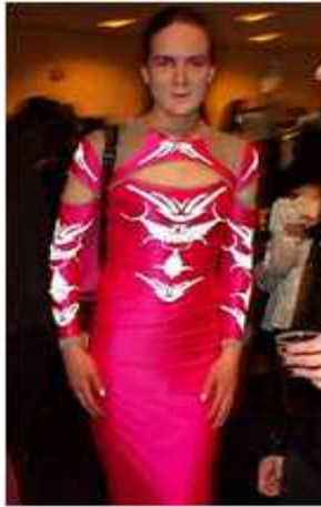
<그림 13> 트랜스 코스 1