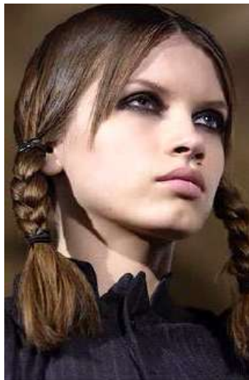
<그림 74> 모던성 3 (2003 F/W Comme des Garcons )