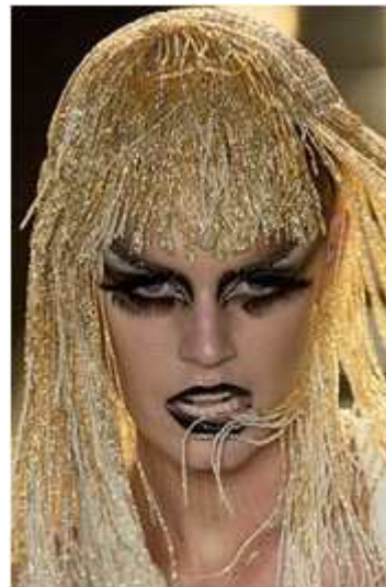
<그림 67> 비애성 8 (2003 S/S Christian Dior www.style.com )