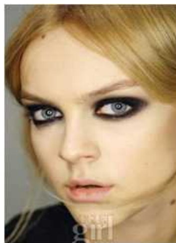
<그림 79> 모던성 8