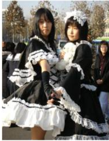
<그림 17> 코스 로리 1 (www.google.com)