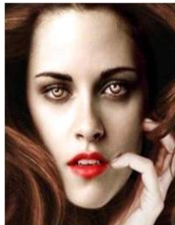
<그림 32> 뱀파이어 메이크업 2