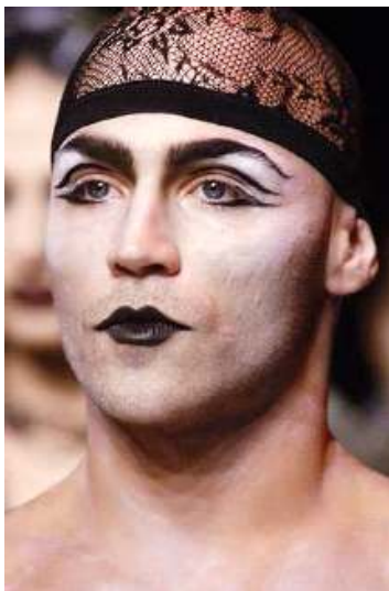
<그림 58> 여성성 11 (2006 S/S John Galliano )