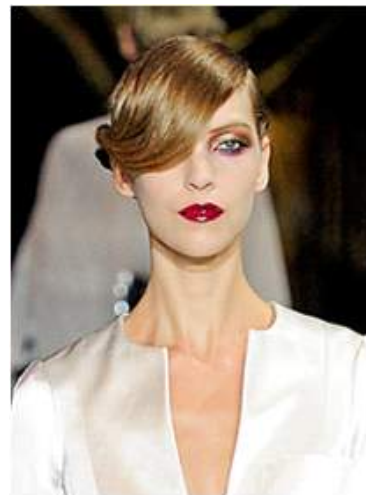
<그림 43> 관능성 8 (2011 S/S Louis Vuitton)