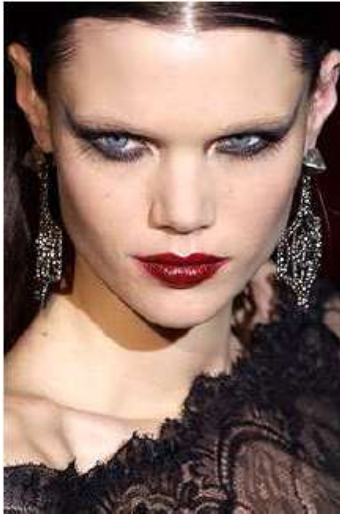
<그림 48> 여성성 1 (2003 S/S Valentino)