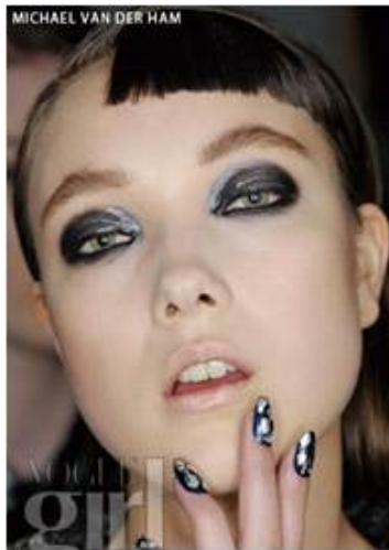
<그림 46> 관능성 11 2013 F/W (Michael van der Ham www.style.com)