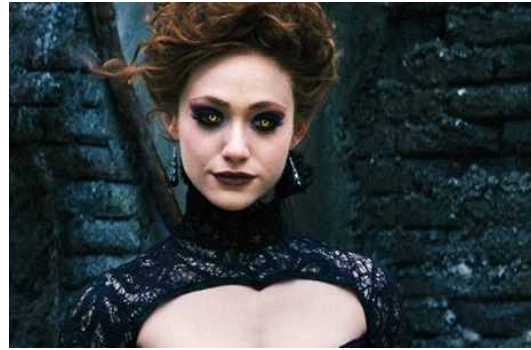
<그림 61> 비애성 2 ( http://blog.naver.com/salonb7?Redirect=Log&logNo=188356402 2013, 11, 19 검색)