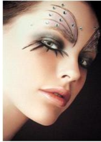
<그림 26> 데테스테 메이크업 2 (www.google.com)