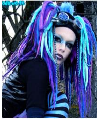
<그림 6> 퍼키 코스 2 ( blog.naver.com/sodamsteam 2013, 10, 15 검색)