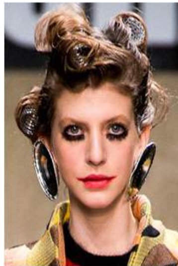
<그림 93> 반항성 12 (2013 F/W Louise Gray www.style.com)