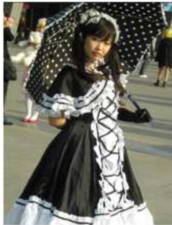
<그림 19> 코스 로리 3 (www.google.com)