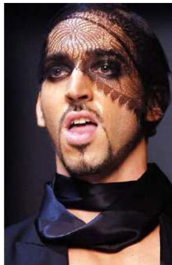
<그림 59> 여성성 12 (2006 S/S John Galliano www.style.com )