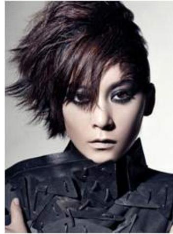
<그림 83> 반항성 2