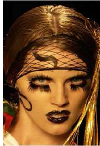
<그림 69> 비애성 10 (2003 F/W Christian Dior www.style.com)