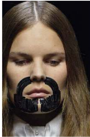
<그림 57> 여성성 10 (2006 F/W Givenchy www.style.com )