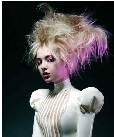
<그림 84> 반항성 3 ( http://blog.naver.com/runta ku?Redirect=Log&logNo=140119166460 2013, 11, 25 검색)