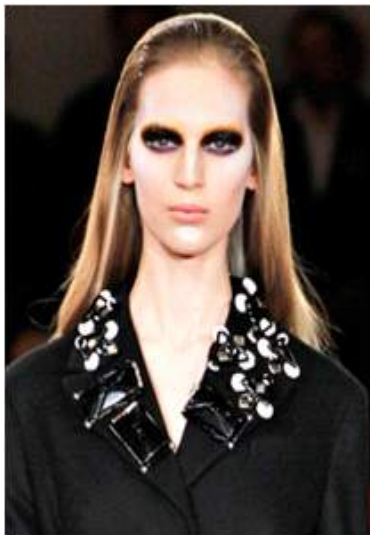
<그림 66> 비애성 7 (2012 F/W Prada www.style.com )