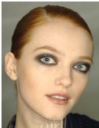
<그림 78> 모던성 7 ( http://www.style.co.kr )