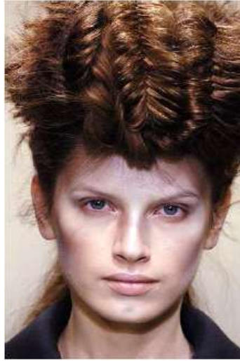
<그림 72> 모던성 1 (2005 F/W Yhoji Ymamoto )