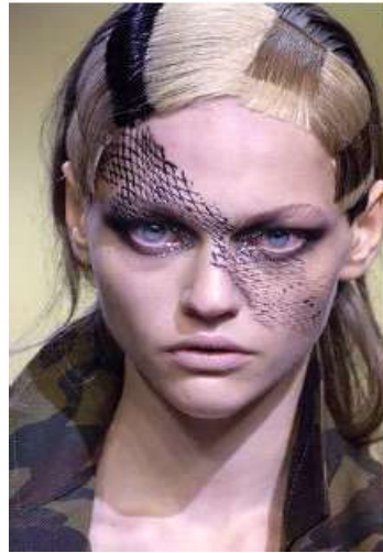
<그림 87> 반항성 6 (2006 S/S Viktor & Rolf www.style.com )