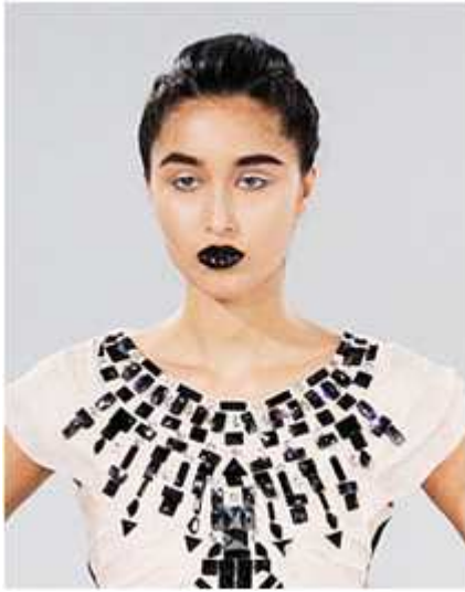
<그림 80> 모던성 9 (2010 F/W Nathan Jenden www.style.com)