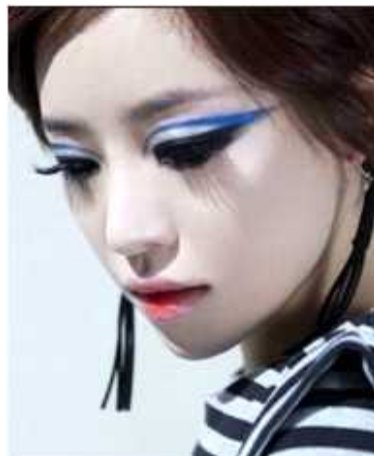
<그림 24> 스모키 메이크업 4