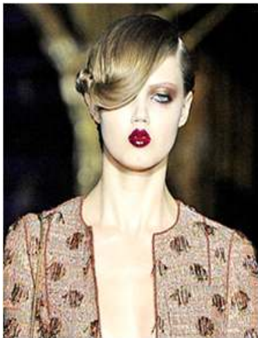
<그림 42> 관능성 7 (2011 S/S Louis Vuitton www.style.com )