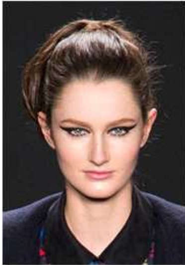
<그림 52> 여성성 5 (2013 F/W Anna Sui www.style.com)