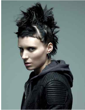
<그림 82> 반항성 1 ( http://media.daum.net/entertain/culture/newsview?newsid=20111229102705992&srchid 2013, 11, 25 검색)