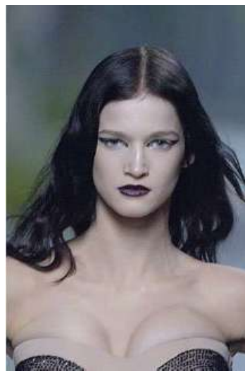
<그림 51> 여성성 4 (2005 F/W Christian Dior www.style.com)