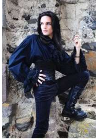
<그림 2> 트레이드 코스 2 ( blog.naver.com/sodamsteam 2013, 10, 15 검색)