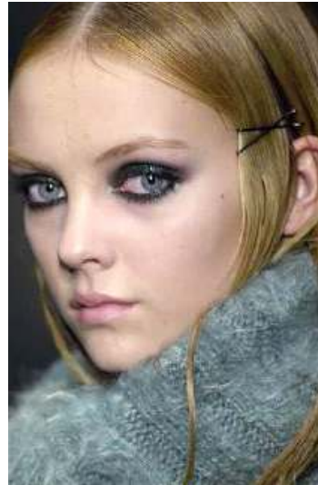
<그림 75> 모던성 4 (2005 F/W Jean Paul Gaultier )