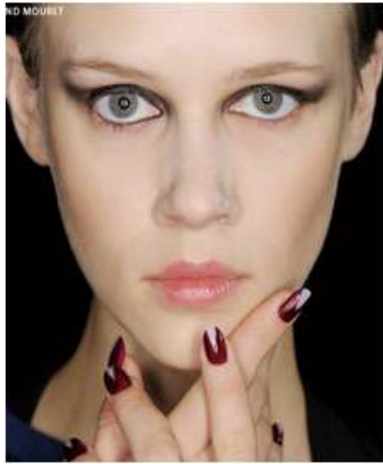
<그림 76> 모던성 5 (2013 F/W Roland Mouret )