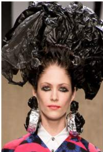
<그림 92> 반항성 11 (2013 F/W Louise Gray www.style.com)