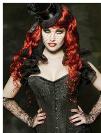
<그림 4> 트레이드 코스 4 ( blog.naver.com/sodamsteam 2013, 10, 15 검색)