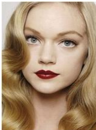
<그림 31> 뱀파이어 메이크업 1 http://www.hrising.com/style/?mode=view&no=1417 2013, 11, 30 검색)