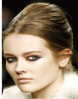
<그림 37> 관능성 2 ( http://www.style.co.kr/beauty/b_view.asp?menu_id=01070101&c_idx=010201010000976 2013, 11, 12 검색)