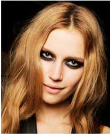
<그림 21> 스모키 메이크업 1 (www.google.com)