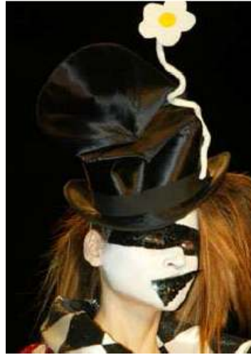
<그림 91> 반항성 10 (2002 S/S Christian Dior)