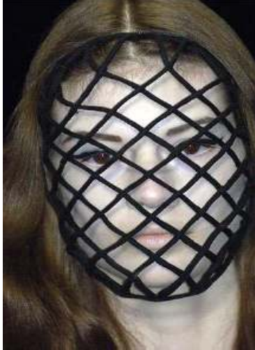
<그림 64> 비애성 5 (2006 F/W Viktor & Rolf www.style.com )