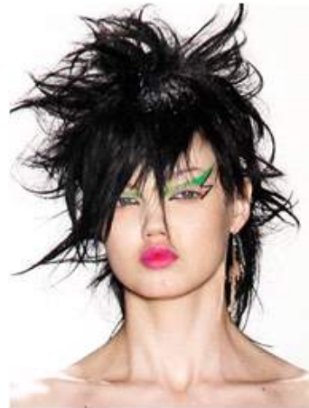
<그림 85> 반항성 4 (2013 F/W Jeremy Scott www.style.com )