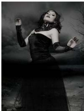
<그림 3> 트레이드 코스 3 ( blog.naver.com/sodamsteam 2013, 10, 15 검색)