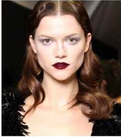
<그림 33> 뱀파이어 메이크업 3