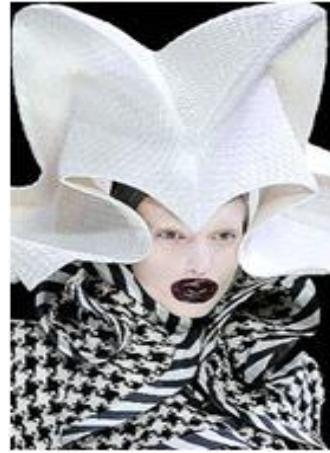
<그림 30> 서리얼리즘 메이크업 4