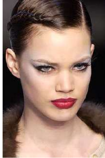
<그림 49> 여성성 2 (2004 F/W Valentino www.style.com)