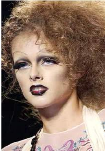
<그림 40> 관능성 5 (2004 S/S Christian Dior )