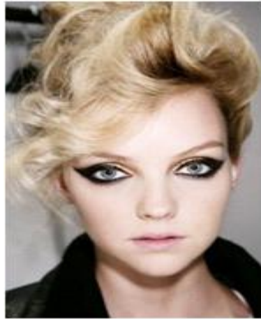
<그림 22> 스모키 메이크업 2 (www.google.com)