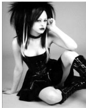
<그림 12> 페티시 코스 3