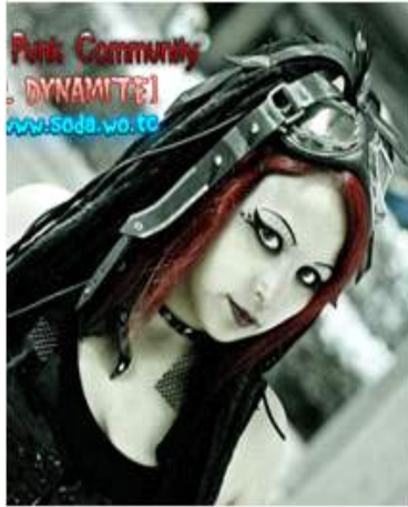
<그림 9> 퍼키 코스 5 ( blog.naver.com/sodamsteam 2013, 10, 15 검색)