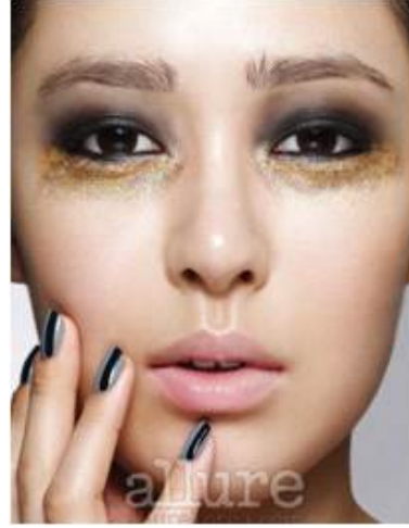
<그림 45> 관능성 10 ( http://www.style.co.kr/beauty/b_view.asp?menu_id=01070201&c_idx=010201010000757 2013, 11, 30 검색)