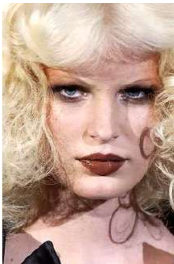
<그림 50> 여성성 3 (2004 S/S Valentino www.style.com)