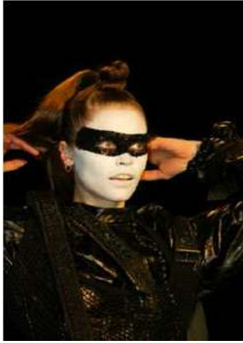
<그림 90> 반항성 9 (2002 S/S Christian Dior www.style.com)