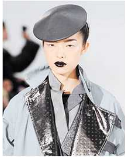
<그림 81> 모던성 10 (2010 F/W Nathan Jenden www.style.com)