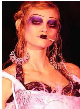
<그림 39> 관능성 4 (2003 F/W Christian Dior www.style.com )