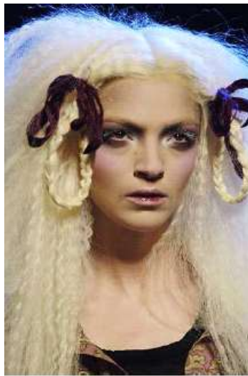
<그림 70> 비애성 11 (2006 F/W John Galliano)