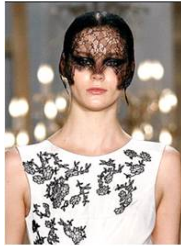
<그림 63> 비애성 4 (2011 F/W Jason Wu www.style.com )