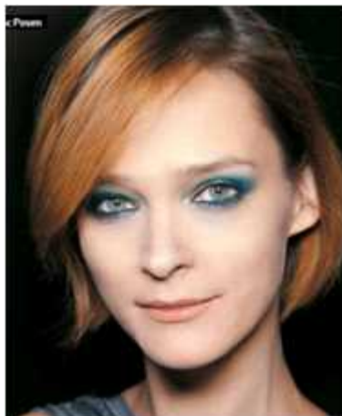
<그림 23> 스모키 메이크업 3 (www.google.com)