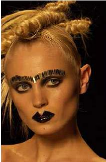
<그림 56> 여성성 9 (2002 F/W Christian Dior www.style.com )