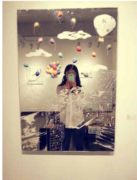
【작품1】 북촌, 60x88, 거울, 세라믹 2014