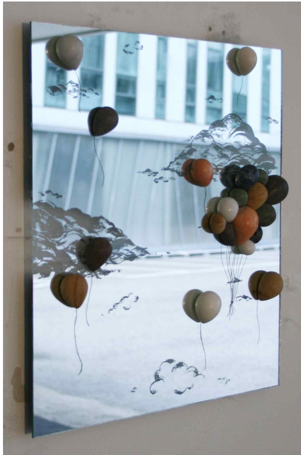
【작품2】 꿈을 날다, 38x42, 거울, 대리석, 사암, 현무암 2014