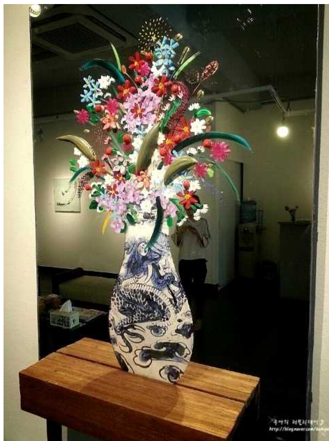
【작품3】 꽃병 룡, 60x40, 거울, 세라믹, 아크릴 물감, 사진 프린트 2014