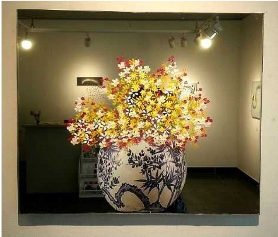
【작품4】 꽃병 죽, 50x42, 거울, 아크릴 물감, 사진 프린트 2014