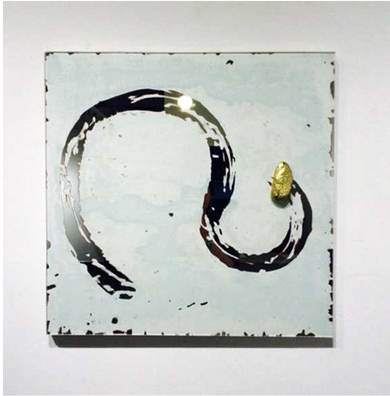
【작품 8】 흐름의 흔적, 60x60, 거울, 자연석 2014