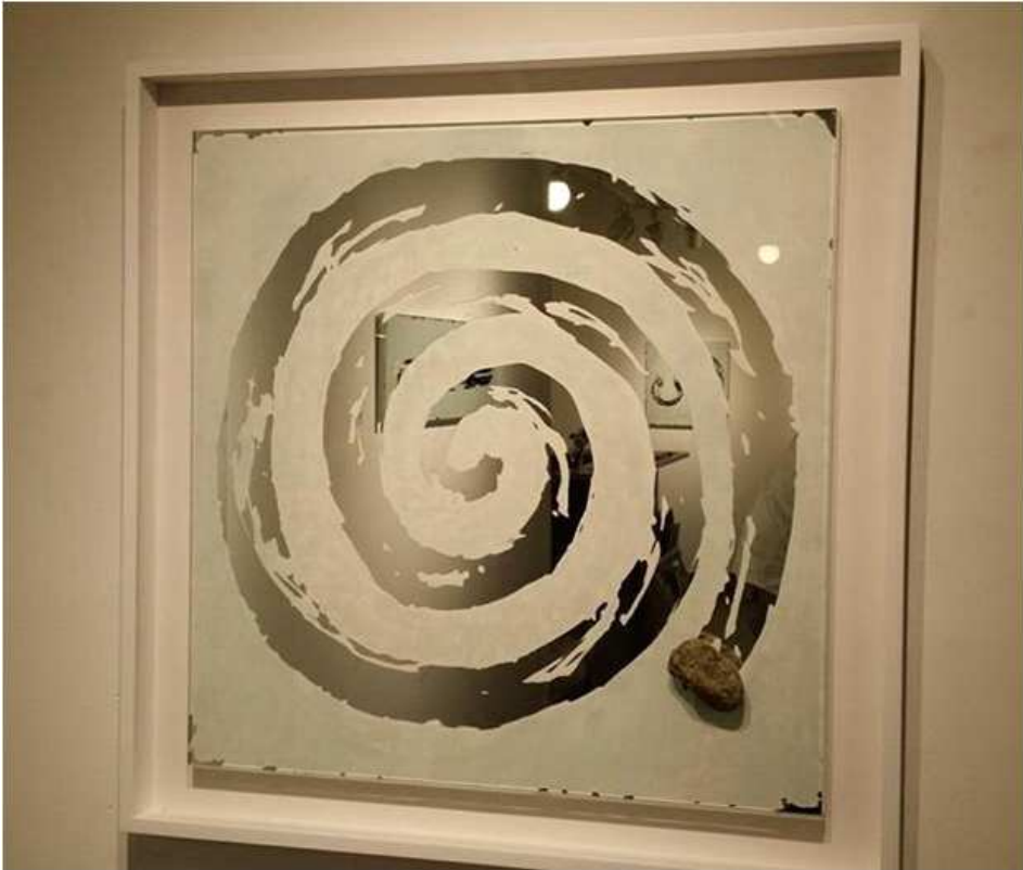
【작품 6】 회오리 흐름, 60x60, 거울, 자연석 2014