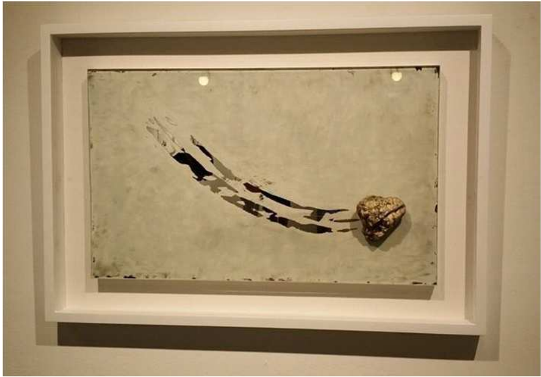
【작품 5】 시간 흔적, 50x30.5, 거울, 자연석 2014