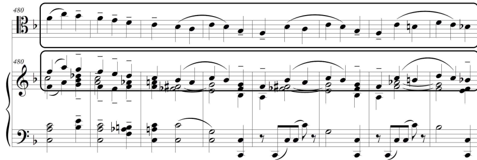
(악보 29) 1악장, 마디 480-487

재현부에서 확대되어 마디 464부터 시작되는 코다는 마디 464부터 505를 첫 번째 부분 그리고 마디 506부터 524의 두 번째 부분으로 나눌 수 있다. 제1주제와 같이 포르티시모( ff )의 강한 화성으로 원조인 F장조로 복귀하며 제시부의 제2주제 C' 부분이 두 악기의 유니즌으로 강하게 재현된다. C' 부분의 재현으로 종결구 부분의 내용이 기대되지만, 예상과 달리 마디 482부터 새로운 선율이 등장하고 계속 유니즌으로 진행된다(악보 29, 참조). 마디 494부터 첼로는 점2분음표의 긴 음가로 음들이 상행하여 화성을 확대하며 코다의 두 번째 부분으로의 진입을 준비한다(악보 30, 참조).