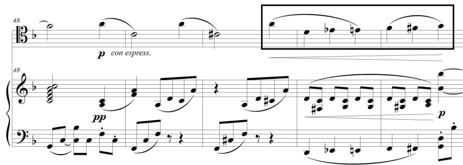
(악보 9) 1악장, 마디 48-52

제1주제 A 부분과 대조적인 분위기를 형성하는 첼로의 B 부분 시작 선율은 A 음이 계속 머무르면서 c^1 - c^{\#1} - d^1 의 반음계 상행이 나타난다. B 부분을 처음 시작할 때 도약 하행(음형 b)이 세 번 나타나고 이후에 나오는 서정적인 선율과 결합이 된다. 마디 40에서 피아노의 오른손이 그대로 주제 선율을 받아 두 악기 간의 짜임새 변화를 보인다(악보 8, 참조). 마디 48에서 첼로가 제1주제 B 부분 선율을 받아서 다시 반복되는데, 음이 변화되는 모습을 볼 수 있다(악보 9, 악보 8 비교참조).