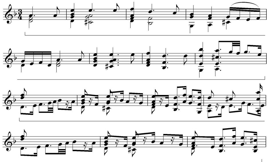
(악보 3) Bach Partita II in d minor for Violin, Finale, mm.1~14

파사칼리아와 샤콘느는 혼동되기가 쉽다. 근본적인 차이점은, 파사칼리아는 기본을 베이스 선율에 둔 변주법의 형태이고, 샤콘느는 화성 연결에 기초를 둔 변주곡의 형태라는 점이다. 하지만 당시 바로크 작곡가들이 두 형식의 명칭을 구별하지 않고 론도(반복 악구에 의한 곡)와 변주곡을 썼기 때문에 오늘날 두 형식의 정의는 비슷하다. 베이스의 반복 주제(오스티나토) 위에서 변주가 이루어지거나, 그 밖의 다른 성부에서도 오스티나토 주제가 나타날 수 있는 경우를 파사칼리아라고 부른다. 한편 반복 악구의 성격을 기준으로 했을 때, 선율 형태로 된 경우를 파사칼리아, 화음 형태인 경우를 샤콘느라고 한다. 파사칼리아는 바로크 시대에 시작해 브람스(Johannes Brahms, 1833~1899), 알반 베르크(Alban Berg, 1885~1935)의 낭