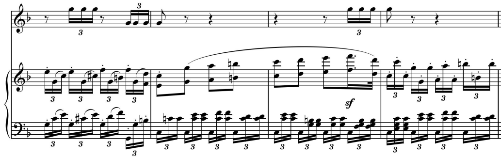
(악보 9) Sonata for Violin and Piano in A Major, Op. 47 2악장 mm. 67~70

테마에서는 주제가 밀집위치의 화성진행이지만, Var. I 에서는 셋잇단음표의 분산 화음형으로 구성된다. 이와 같이 셋잇단 음표의 음형을 사용하여 선율 변주가 되는 예는 베토벤의 피아노 소나타·변주곡집에서 많이 발견된다. 이와 같은 예는 Sonata for Piano in A \flat Major, Op.26의 1악장 Var. V(악보 10), 32 Variations in c minor, WoO. 80 Var.VI (악보 11), 32 Variations in c minor, WoO.80 Var.XXIX (악보 12), 5 Variations in D Major, WoO.79 Var.III (악보 13), 12 Variations In A Major, WoO.71 Var.VII (악보 14)에서 그 예를 찾아볼 수 있다.