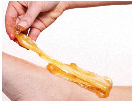
그림3. 슈가링 왁싱