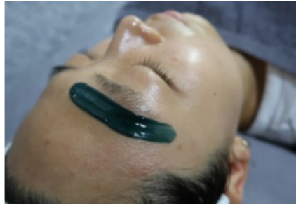
그림2. 하드 왁싱