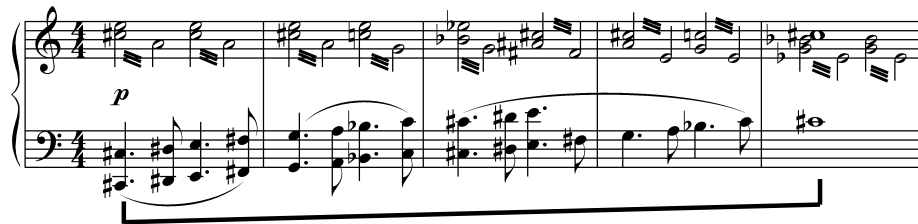
8음음계에 의한 베이스 진행

이러한 립스키코르사코프의 영향으로 스트라빈스키의 발레곡 <페트르슈카 (Petrushka, 1911)>에서는 서로 다른 인물 묘사를 위해 음계, 선율, 화성, 리듬을 중복시키거나 대조되는 악기법을 사용하였다. 이 작품에서는 클라리넷 1은 다장조로 클라리넷2는 올림바장조가 동시에 나타나 복조적인(Polytonality) 성격을 띤다. 37)