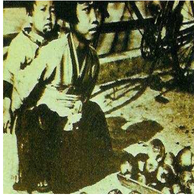
[그림2] “동생을 등에 업고 사과를 파는 소녀 행상” 24)

동생을 업고, 사과를 파는 소녀의 모습도 이와 유사한 사례이다. 해방 직후 열악한 경제적인 상황에 몰려 많은 여성이 생활일선에 나서야 했다. 그런데 이 시기의 여성을 가정에서 육아는 물론 생계까지 책임을 져야하는 모습으로 그려내고 있는 것이다.