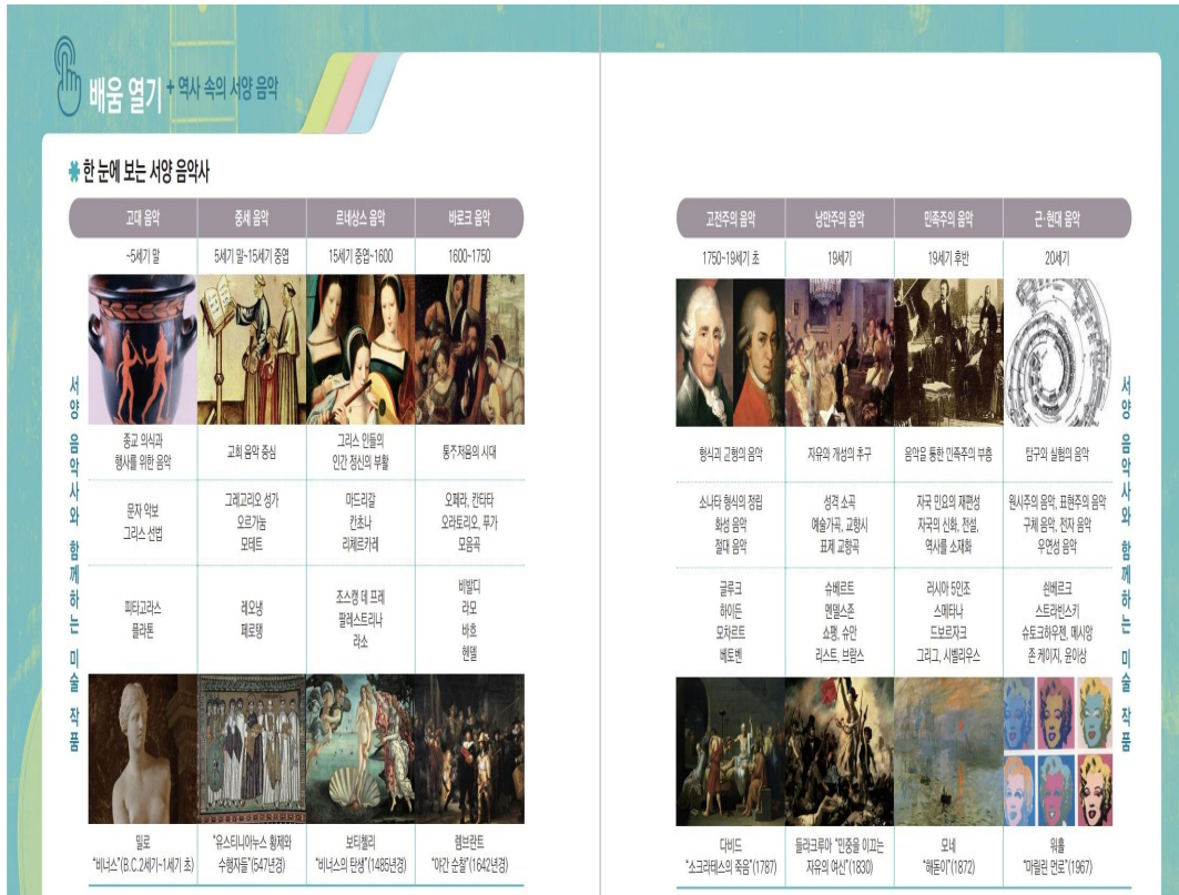
<그림 IV-4> 아침나라의 ‘배움 열기’44)

아침나라는 <그림 IV-4>와 같이 단원의 시작 부분에 ‘배움 열기’라는 제목으로 연대기를 그 시대의 미술작품과 함께 제시하였다.