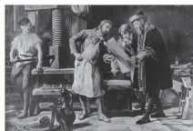
▲ 인쇄술의 발달