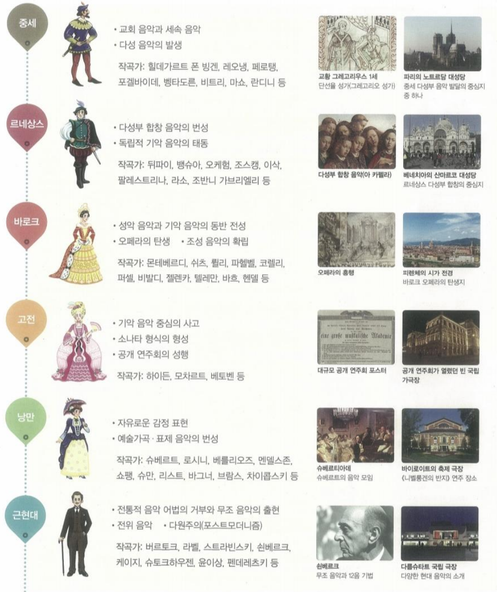
<그림 IV-2> 비상교육의 시대별 특징 42)