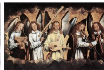
▲ 기악 음악의 발달