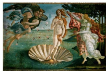
▲ 르네상스의 미술